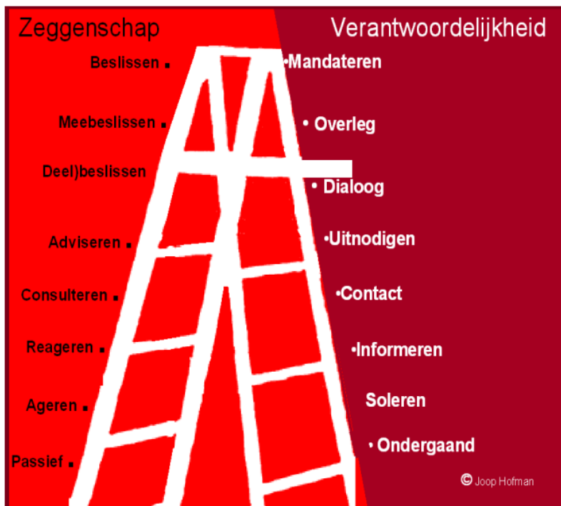
(figuur 1: VNG. De auticipatieladder en de achterkant van de burgerparticipatie (2000))

Het Cluster Maashorst zal frequent in overleg te gaan met (mogelijke) gebruikers. Hierbij krijgen vertegenwoordigers en gebruikers de mogelijkheid om voorstellen te doen en problemen aan te kaarten. Ook zal het Cluster betrokkenen tijdig informeren over en betrekken bij de totstandkoming van nieuwe beleid en/of operationele plannen. Gezamenlijk wordt de agenda bepaald, er is transparantie over wat er wel/niet met de resultaten van het overleg gebeurt.