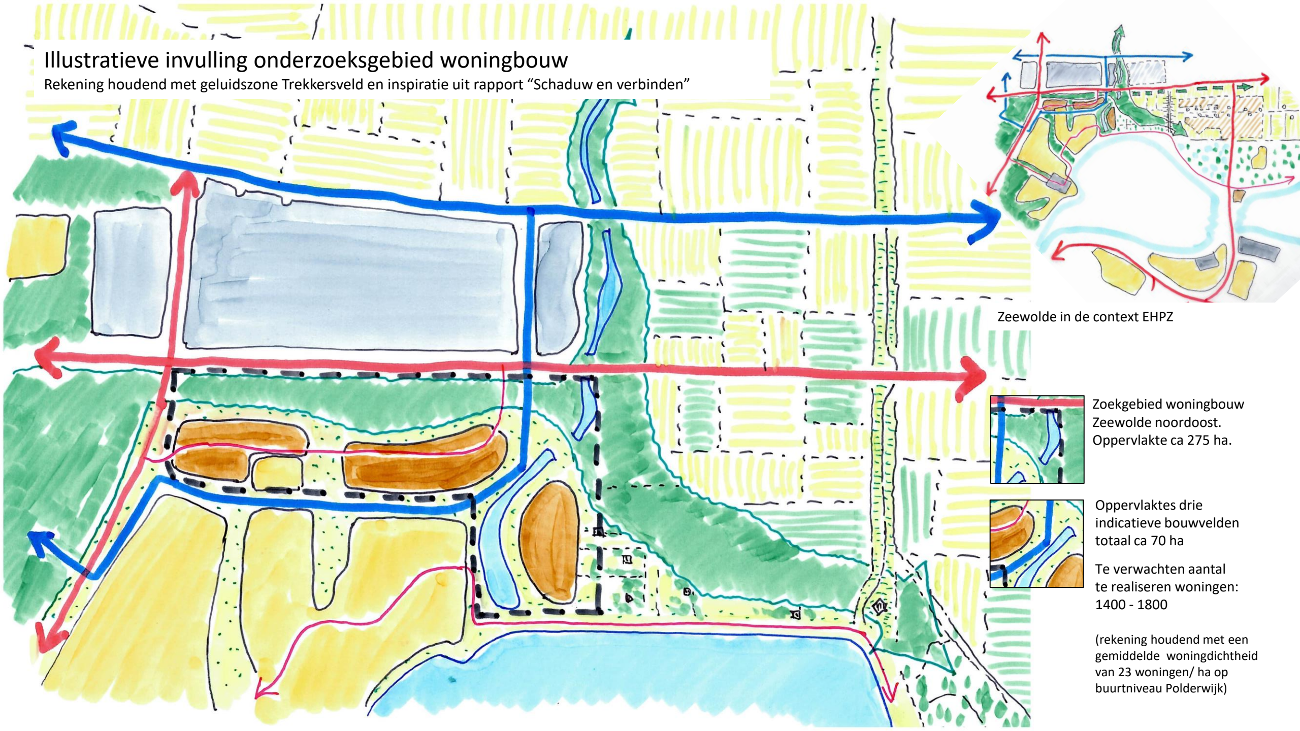
Zeewolde in de context EHPZ

Rekening houdend met geluidszone Trekkersveld en inspiratie uit rapport "Schaduw en verbinden"