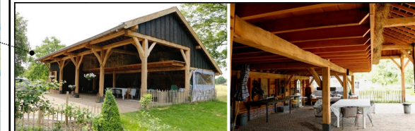
Impressie nieuwe schuur links/rechts spiegelbeeld rechts opslag en verwerking. Links recreatie doeleinde. Rechts 250 extra zonnepanelen.