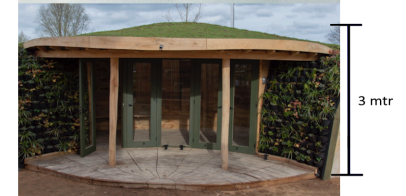
Impressie sanitair met groen dak