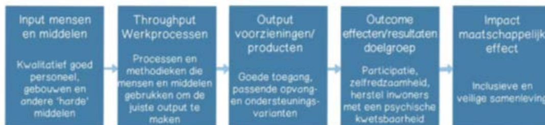
Figuur 4 Effectketen van Robbe, 2018

Samen met de ontwikkelagenda blijven beide uitvoeringsdocumenten de koers voor de komende jaren die gaande weg kan worden bijgestuurd op basis van de uitgangspunten in dit koersdocument, nieuwe ontwikkelingen, de ontwikkeling van de zorgvraag in de regio of nieuwe wet- of regelgeving.