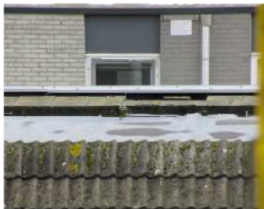
26/10, grote gele kwikstaart , Aukje Gjaltema