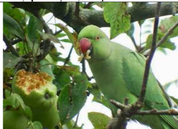
12/10, halsbandparkiet , tuin, Geesje Veenbaas.