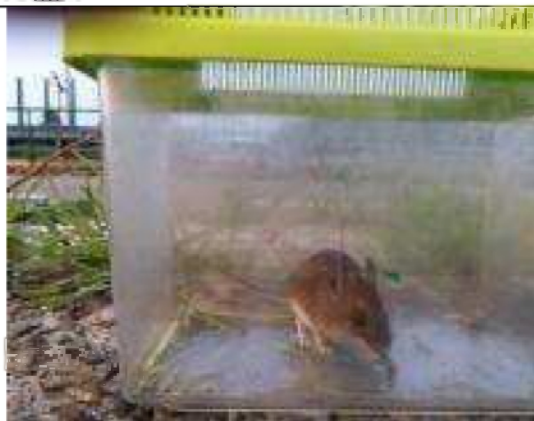
20/10, gewone bosmuis , omgeving Melarium, Pieter Drenth