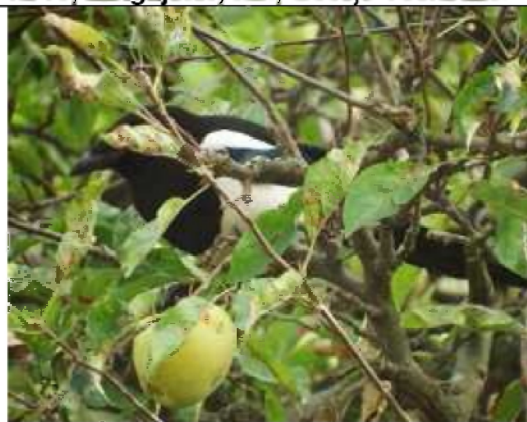
12/10, ekster , tuin, Geesje Veenbaas.