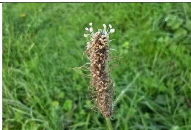
16/10, de hoogste bloei van smalle weegbree , Van Weerden Poelmanpad Jos van Koppen.