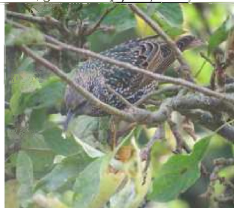
12/10, spreeuw , tuin, Geesje Veenbaas.