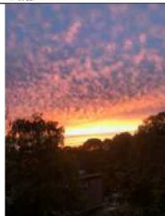
20/10, herfstochtend , Bruun vd Steuijt.