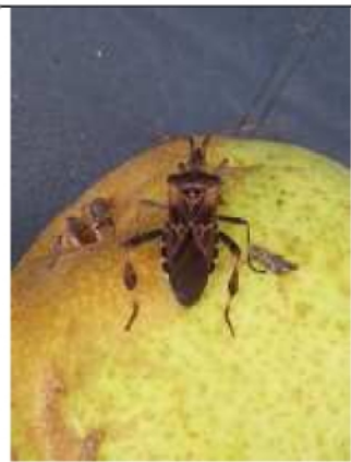
28/09, bladpootrandwants op kweeper, Huub van 't Hart.