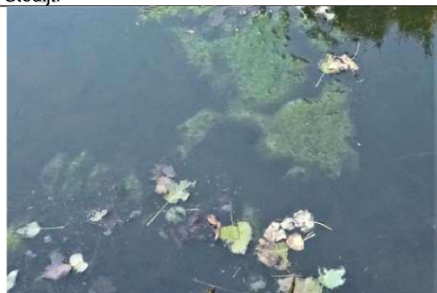
16/10, drijvend wier met luchtballen, Van Weerden Poelmanpad, Jos van Koppen.