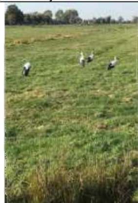
16/10, 13 ooievaars , Woudweg, Midden-Delfland, Bruun vd Steuijt.