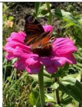
14/10, dagpauwoog op zinnia , kindertuin de Boterbloem, Bruun vd Steuijt.