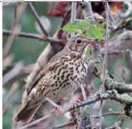
12/10, zanglijster , tuin, Geesje Veenbaas.