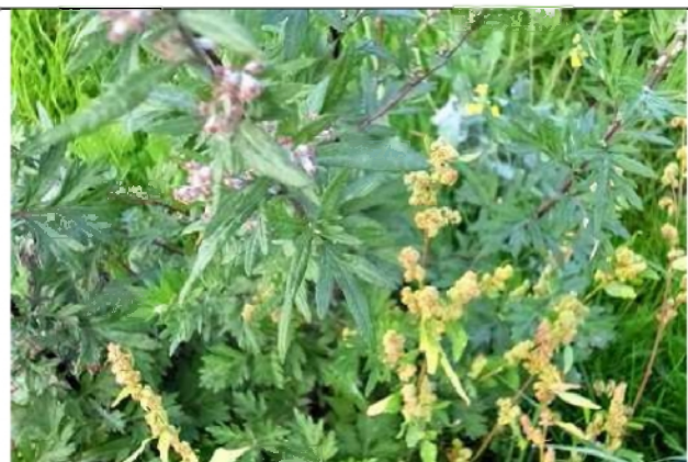
16/10, bloeiende melde en bijvoet , Van Weerden Poelmanpad, Jos van Koppen.