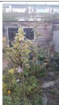
Een eetbare tuin Sanne van den Heuvel, Delft