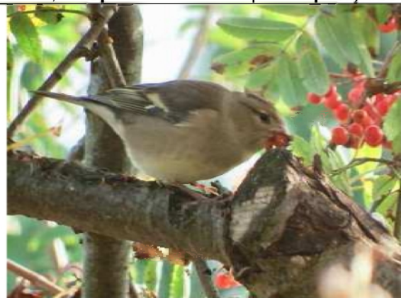
12/10, goudhaantje , tuin, Geesje Veenbaas.