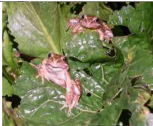
07/10, bruine kikkers , Geesje Veenbaas.