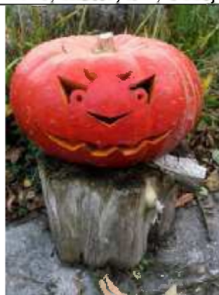
14/10, pompoen , kindertuin De Boterbloem. Bruun vd Steuijt.