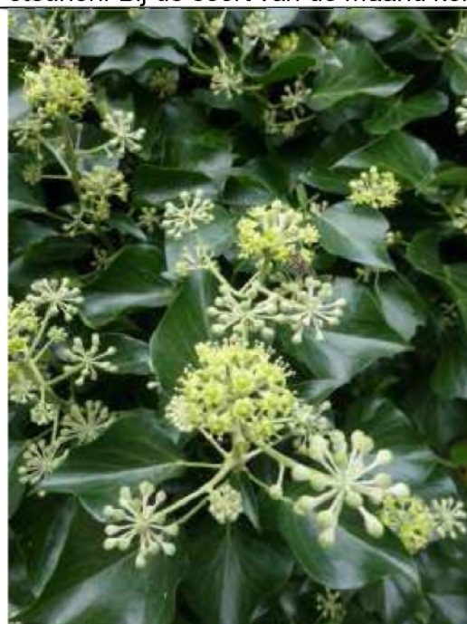
Klimop, Anna Kreffer

In 2018 is het jaarthema Bescherm de natuur in je eigen omgeving. Bij eigen omgeving denken we al gauw aan een tuin, maar stadsbewoners hebben vaak geen eigen tuin. Mensen zonder tuin kunnen iets doen met een balkon, geveltuin, boomspiegel of gemeentegroen. En bij beschermen van de natuur kun je ook denken aan de keuzes die je maakt als persoon, voedsel en verzorging en de aankleding en inrichting van je huis. Kies bijvoorbeeld biologisch voedsel om de omslag naar natuurinclusieve landbouw te steunen. Bij de soort van de maand komen ook tips voor het beschermen van deze soort