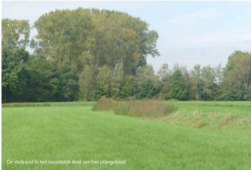
De steilrand in het noordelijk deel van het plangebied