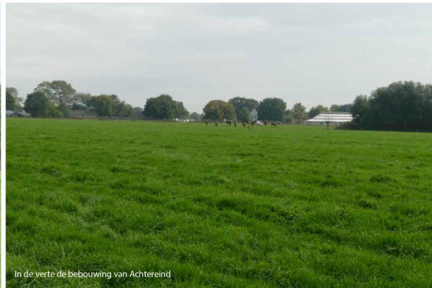
In de verte de bebouwing van Achtereind