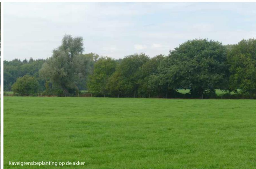
Kavelgrensbeplanting op de akker