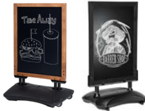
Materiaal: hout + kunststof

Per detailhandel wordt één stoepbord toegelaten. Onderstaand bordengamma voldoet niet: