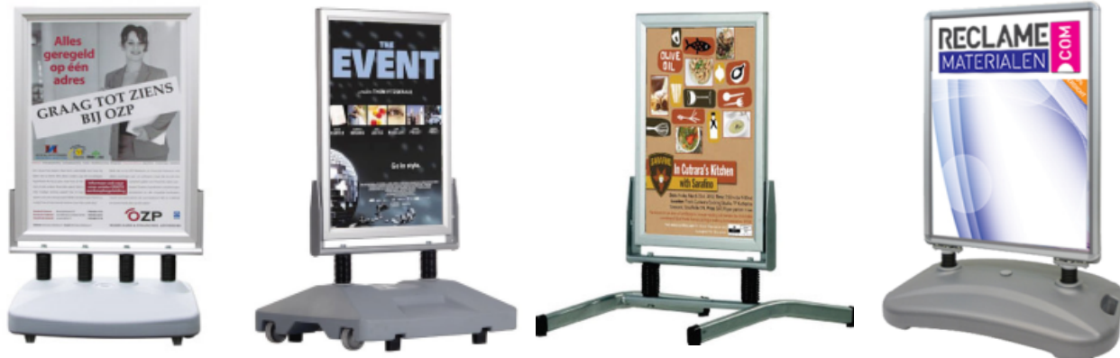
Materiaal: aluminium + kunststof