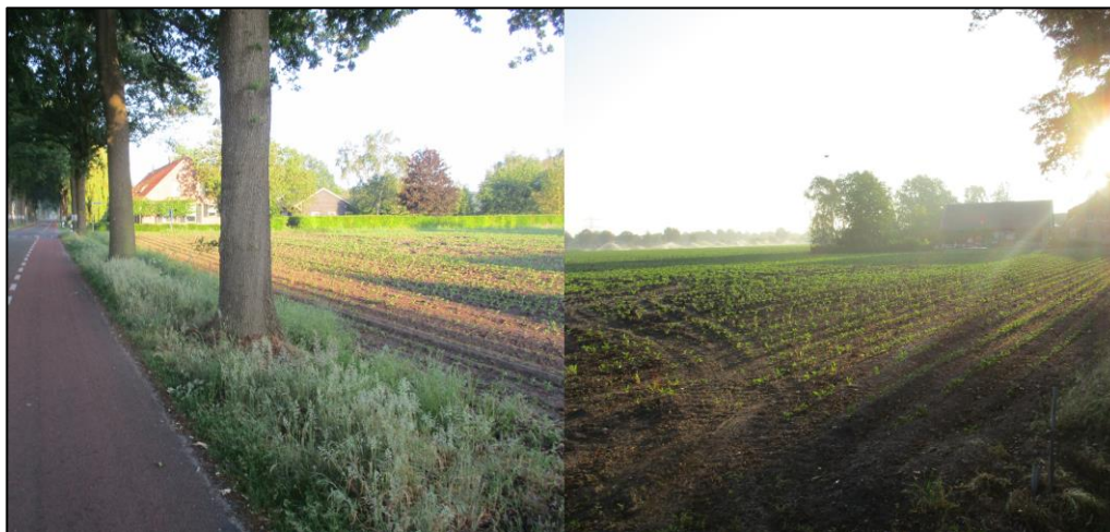
Figuur 2 Fotografische indruk van de planlocatie en de directe omgeving hiervan.