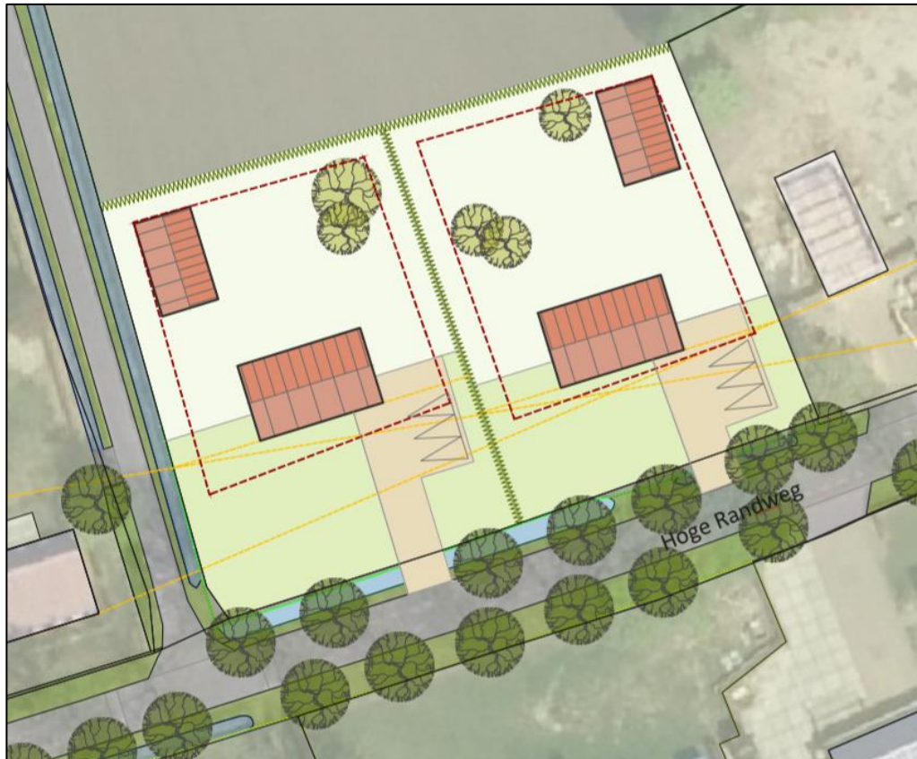
Figuur 3 Visuele representatie van de beoogde situatie.