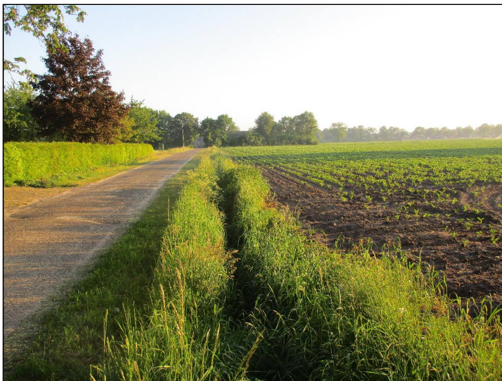
Figuur 1 De planlocatie is gelegen aan de Hoge Randweg ong. te Volkel en betreft een akkerperceel.