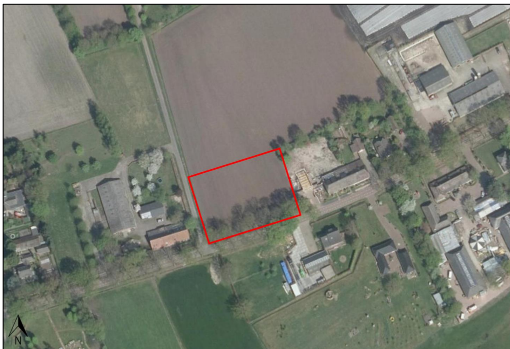
Figuur 1 De planlocatie (rood omkaderd) is gelegen aan de Hoge Randweg ong. te Volkel.

De directe omgeving van de planlocatie wordt gekenmerkt door landelijk gebied en wordt omringd door agrarische percelen. Op circa 700 m ten oosten ligt het centrum van Volkel en op circa 900 m ten noorden ligt de N284 met daarachter Uden.