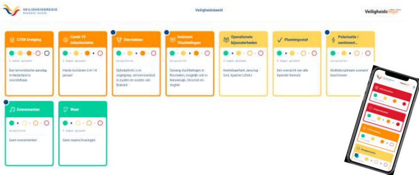
Figuur 2. Voorbeeld portal Veiligheids Informatie Knooppunt (VIK)

De geïdentificeerde risico's verlangen een constante interpretatie en duiding met als doel snel, en op een passende schaal, te kunnen schakelen en ingrijpen als een risico zich aandient. Hiervoor moeten we (scenario-)analyses maken, om zo gericht te kunnen bepalen hoe met het risico moet worden omgegaan. Dit gebeurt met analyse- en scenario teams . Op operationeel niveau wordt hiervoor een Veiligheid Informatie Knooppunt (VIK) (zie als voorbeeld figuur 2) bij de meldkamer gerealiseerd. Bij risico's met een tactisch of strategisch karakter worden de teams samengesteld aan de hand van het specifieke karakter van het risico dat op basis van de veiligheidsradar wordt herkend.