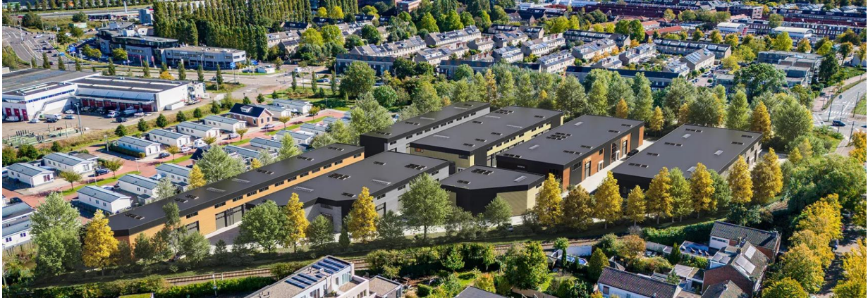
Afbeelding 12. Impressie van bedrijvenpark Reineveld (Pr8 architecten)

Dit terrein van het voormalige recyclingbedrijf wordt in drie fasen ontwikkeld tot een bedrijventerrein, waarbij alle drie de planfasen in 2025 door de Adviescommissie beoordeeld zijn. Opvallend hierin was de hoge ecologische ambitie die verwerkt zit in het plan voor een nieuw bedrijventerrein.