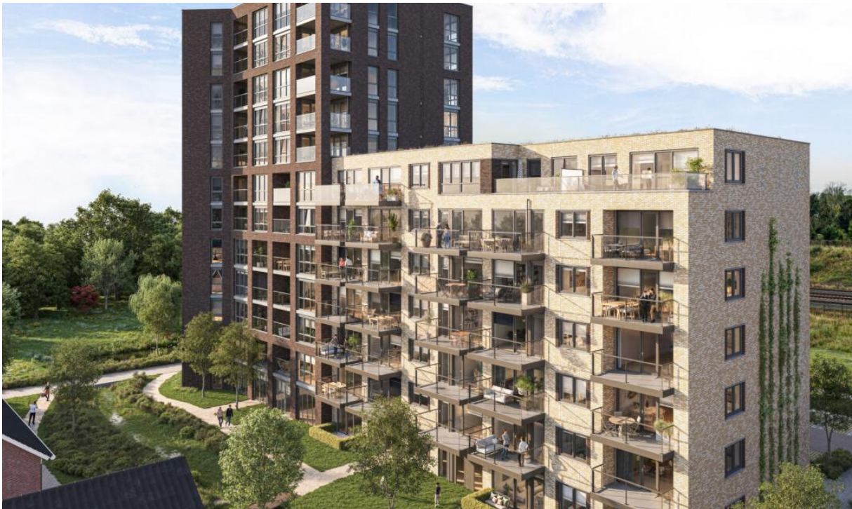
Afbeelding 11. Impressie van Parkrijke (Klunder Architecten)

Ook heeft de Adviescommissie woontoren en appartementengebouw Parkrijk, gelegen in deelgebied Parkrijk, diverse keren als conceptaanvraag behandeld.