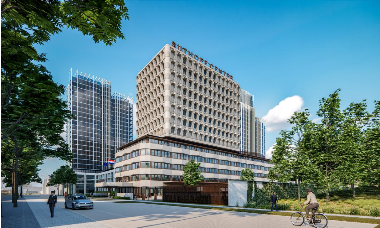
Afbeelding 2. Impressie van Sijthoff Center (AAArchitecten, BoschSlabbers)