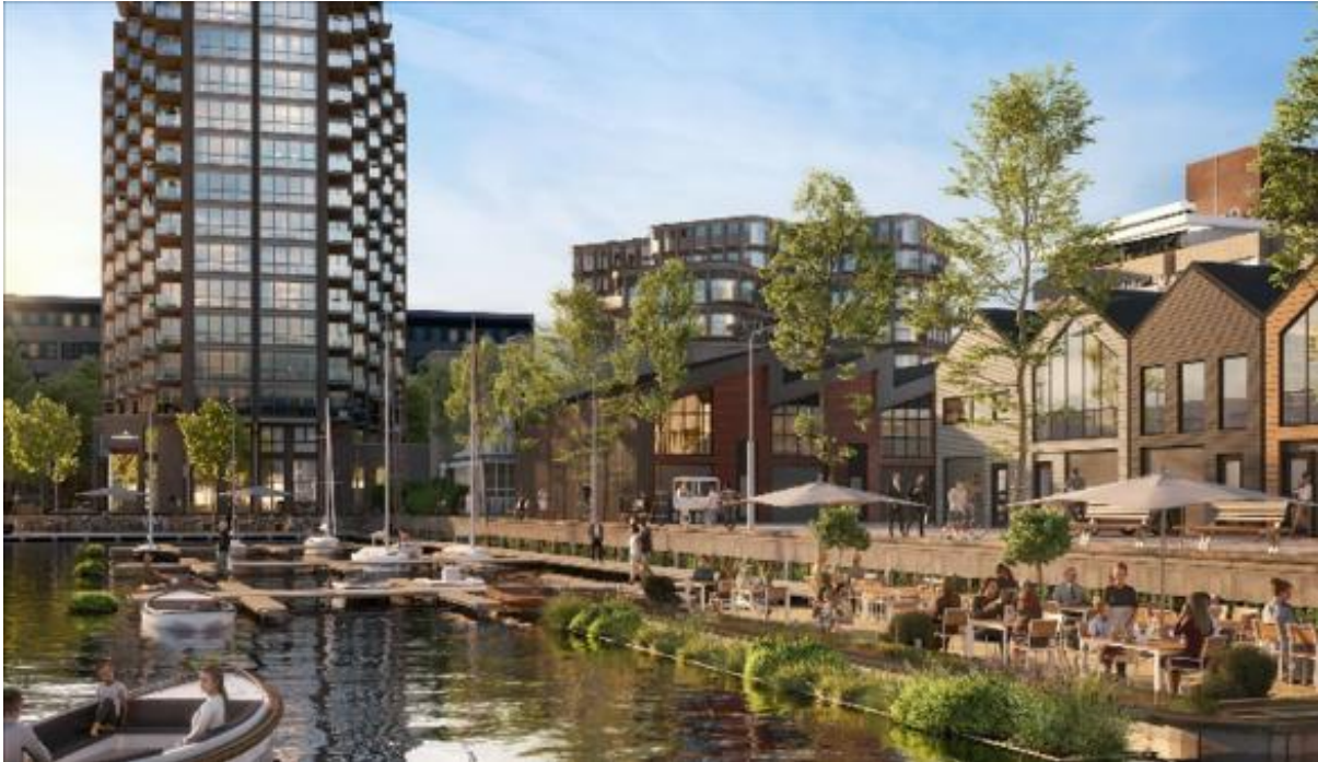
Afbeelding 4. Impressie van woon- en voorzieningengebouw Havenmeester (links) en de herontwikkeling van de haven (Architekten Combinatie)

In 2025 werd de sloop en nieuwbouw van woongebouw de Havenmeester als woongebouw met bedrijf- en voorzieningsruimten veelvuldig besproken, waarna het plan eind 2025 de vergunningsfase is ingegaan.