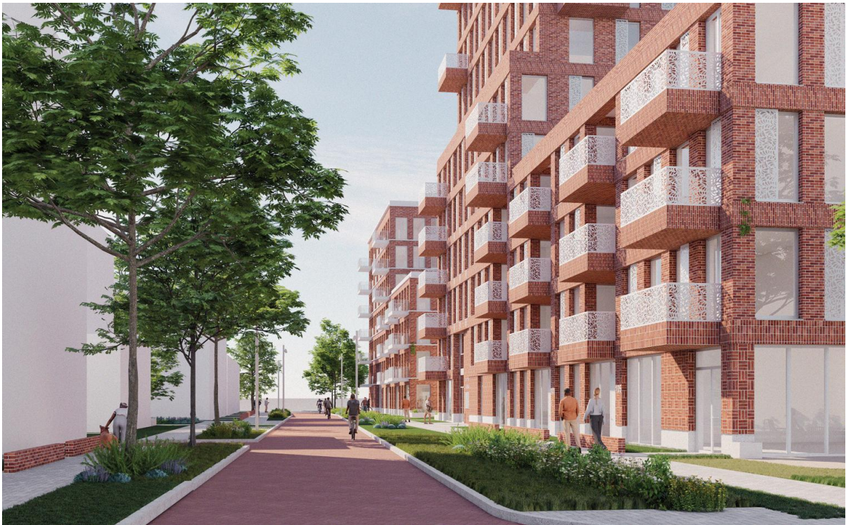
Afbeelding 9. Impressie van Te Werve Oost – fase 1 (Mecanoo)