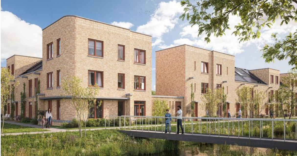
Afbeelding 10. Impressie van Buitenhof (Zeinstra Veerbeek Architecten)

Het project Buitenhof, gelegen in deelgebied Pasgeld, betreft een plan voor 36 herenhuizen en 6 specials. Dit project is diverse keren door de Adviescommissie behandeld.