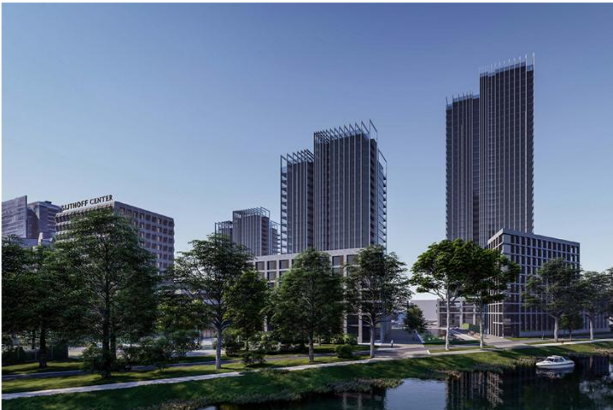
Afbeelding 3. Impressie van Sijthoff Residences (AAArchitecten)

In samenspraak met de herontwikkeling van Sijthoff Center zijn in 2025 conceptplannen voor Sijthoff Residences, de herontwikkeling van het achtergelegen gebied, behandeld door de Adviescommissie. Volgens deze plannen wordt het gebied ontwikkeld als nieuw woon- en werkgebied.