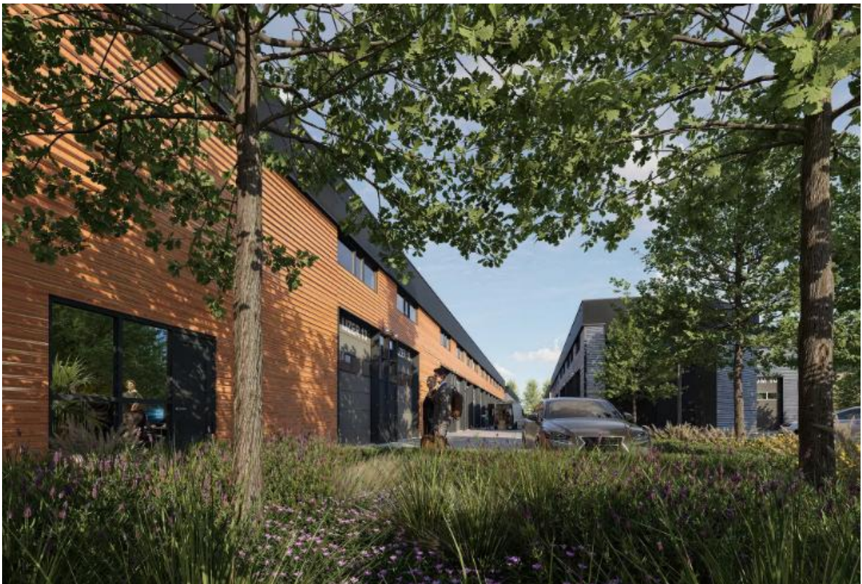
Afbeelding 13. Impressie van bedrijvenpark Reineveld (Pr8 architecten)