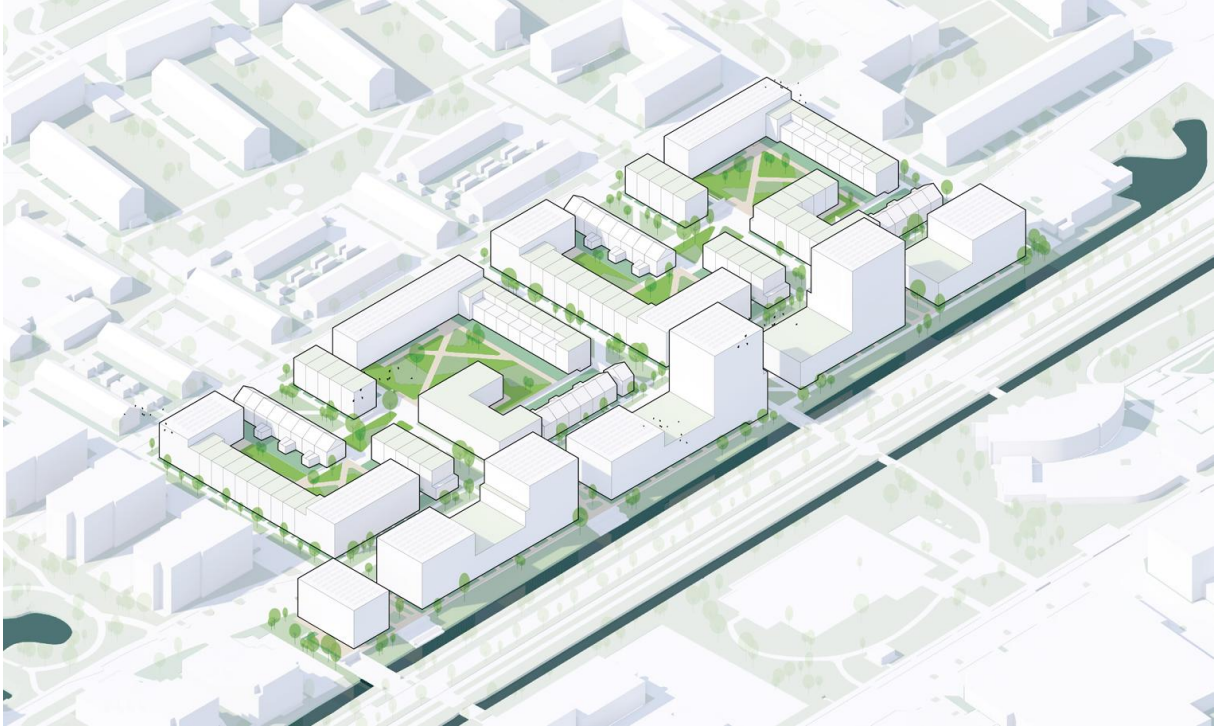
Afbeelding 8. Schematische weergave van de herontwikkeling van Te Werve Oost (Mecanoo)

Langs de Sir Winston Churchillaan staat een grootschalige sloop-, renovatie en nieuwbouwopgave op de planning, Te Werve Oost genoemd. Dit plan wordt in zes planfasen ontwikkeld, waarbij in 2025 een start is gemaakt met fase 1 (sloop en bouw van twee nieuwbouwblokken) en de herinrichting van de openbare ruimte. De Adviescommissie heeft dit plan meermaals beoordeeld in 2025.