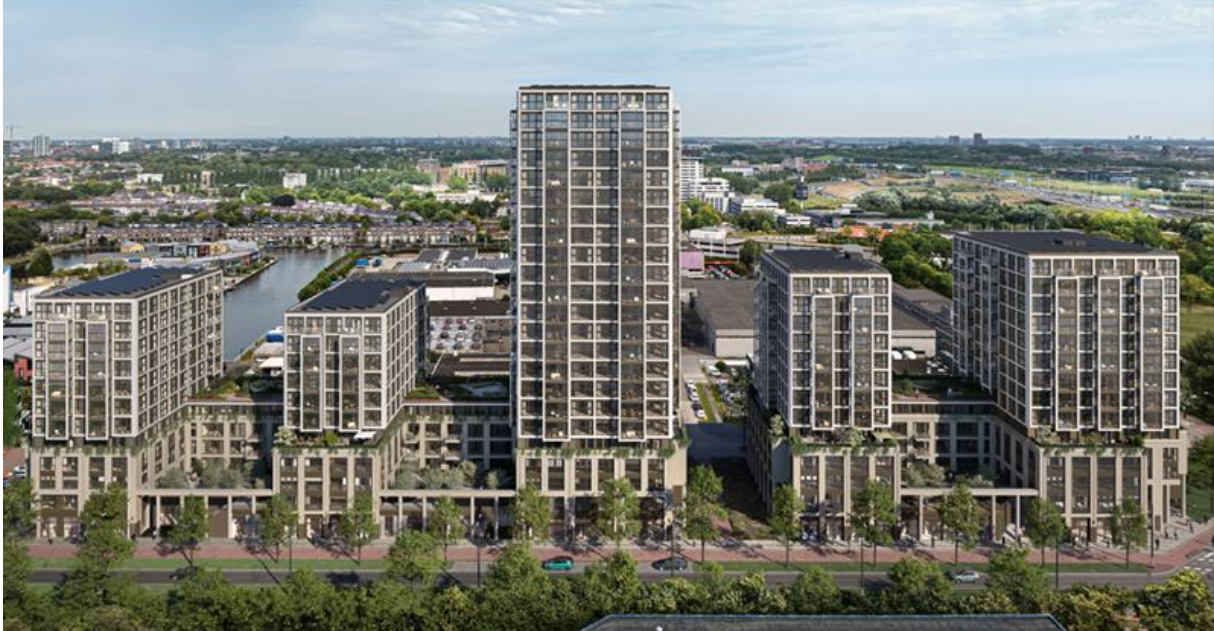
Afbeelding 6. Impressie van Urban Parks (Kampman Architecten)

Langs de Burgemeester Elsenlaan is een groot nieuwbouw van woon- en voorzieningencomplex Urban Parks gepland met woningen, een supermarkt, zorgvoorzieningen en bedrijven. De Adviescommissie heeft dit plan, nadat het lange tijd stil heeft gelegen, in 2025 opnieuw voorbij zien komen als conceptaanvraag.