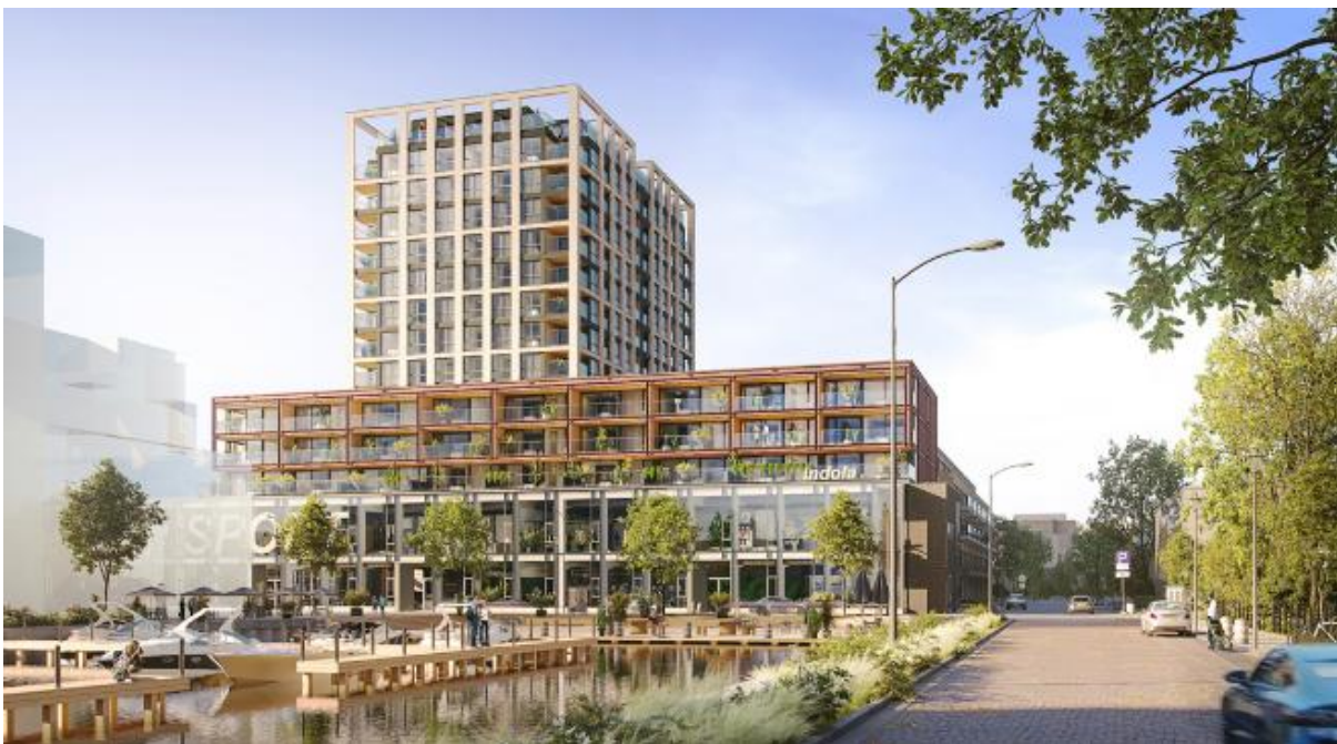
Afbeelding 5. Impressie van Harbourpark (Mies Architectuur)

In 2025 is de herbestemming van de voormalige Indolafabriek tot verzamelgebouw Harbourpark met ruimte voor wonen, bedrijvigheid en voorzieningen, veelvuldig besproken.