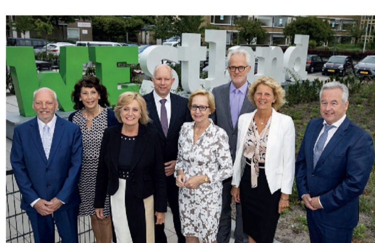
Het college van burgemeester en wethouders

Een belangrijk uitgangspunt is dat de inkomsten en uitgaven van de gemeente in balans zijn. Dat is het geval, maar we zien wel dat er de komende jaren weinig financiële ruimte is voor nieuwe wensen en ambities. De komende maanden gaan we alle taken en ambities die we hebben tegen het licht houden en samen met de gemeenteraad en de Westlanders bepalen waar we ons geld aan uit gaan geven. Dat kan leiden tot andere keuzes dan u tot nu toe van ons gewend bent. We nodigen iedereen van harte uit om aan deze discussie deel te nemen!