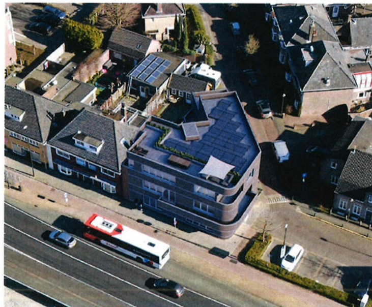
Ontwikkeling Eindhovenseweg 54-56: 6 appartementen

De omgevingsdialoog is gevoerd, de anterieure overeenkomst ondertekend en de omgevingsvergunningsprocedure loopt. Naar verwachting start de sloop begin 2023 en is de realisatie voorzien in 2024.