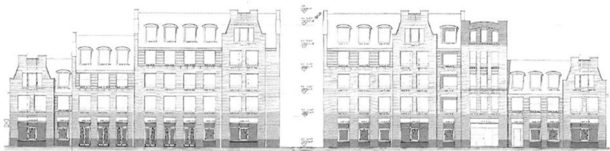
Transformatie van commerciële plint in complex Brederode naar 10 appartementen.