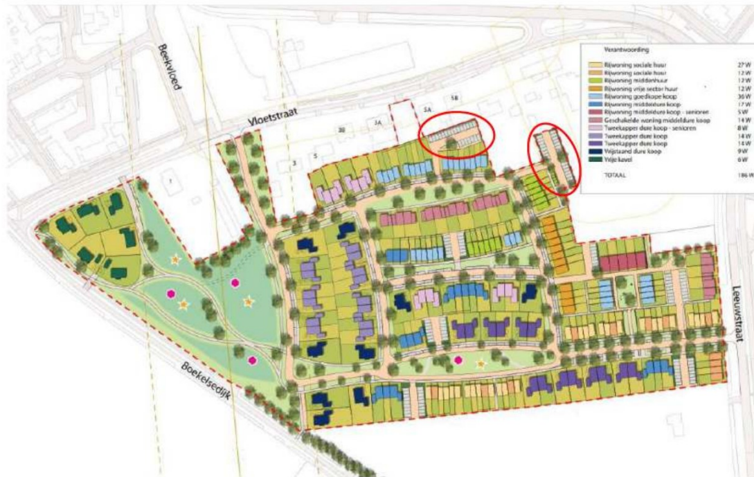
Figuur 1.2: Verkaveling

De geluiduitstraling is bepaald aan de hand van berekende immissieniveaus op de gevels van de meest nabij gelegen woningen nabij de parkeerplaatsen, te weten Vloetstraat 3a, 5a, 5b, 7, 9, 11, 23 en 25. Het betreft zowel het bepalen van de langtijdgemiddelde beoordelingsniveaus L_{A,LT} als de maximale niveaus L_{A,max} .