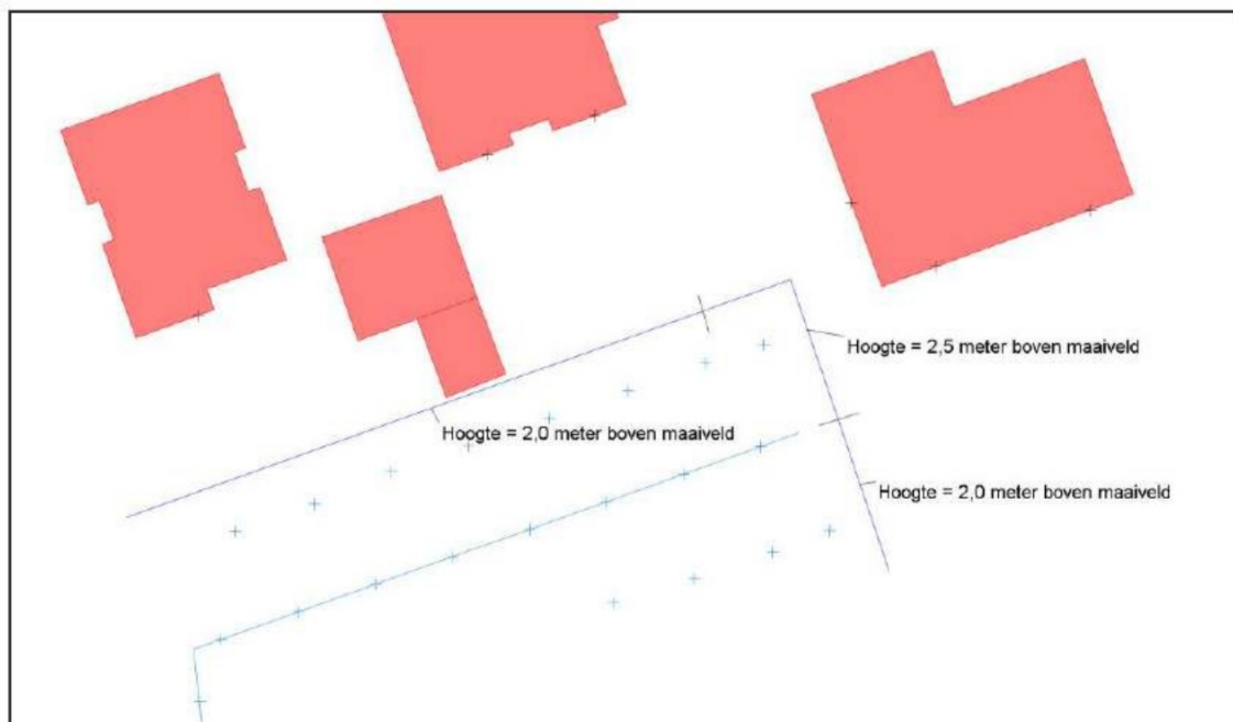
Figuur 3.1: Hoogte aanduiding scherm om noordelijke parkeerplaats.

Bij het onderzoek is gebruik gemaakt van een door de opdrachtgever verstrekte situatietekening, kaartmateriaal van de Publieke Dienstverlening op de Kaart (PDOK), het Actueel Hoogtebestand Nederland (AHN4) en Google Streetview. In Bijlage I is de gehanteerde situatietekening opgenomen. Aan twee zijde van de meest noordelijk gelegen parkeerplaats is rekening gehouden met een scherm met een hoogte van gedeeltelijk 2 en gedeeltelijk 2,5 meter boven maaiveld, geheel gesloten uitgevoerd en met een minimale massa 10 kg/m 2 . In Figuur 3.1 is het scherm en de hoogtes opgenomen.