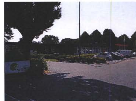
Heropening locatie Sourethweg