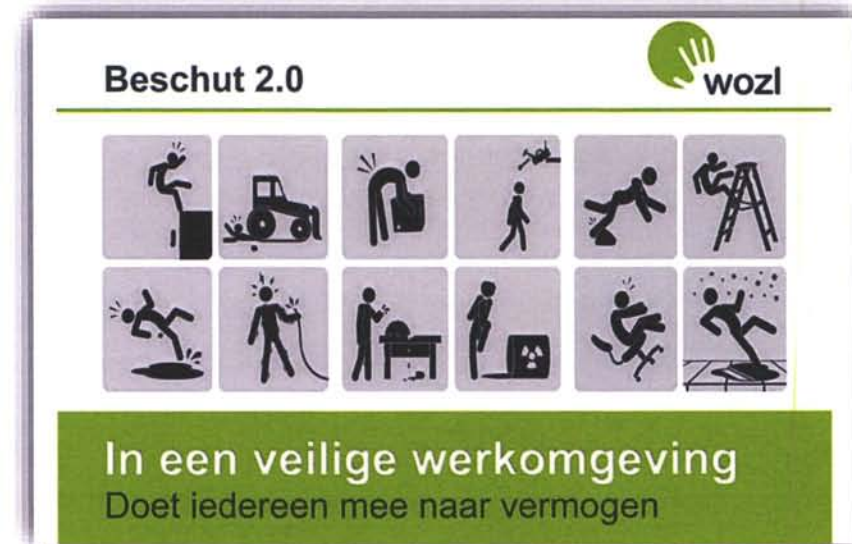
Poster in het kader van het thema "veiligheid".

Binnen Beschut 2.0 wordt per kwartaal een belangrijk thema op de werkvloer besproken. In Q2 was er extra aandacht voor "veiligheid". Volgend kwartaal staat het thema "opgeruimd staat netjes" op het programma, een thema dat aansluit bij de hernieuwde werkomgeving van Beschut 2.0.