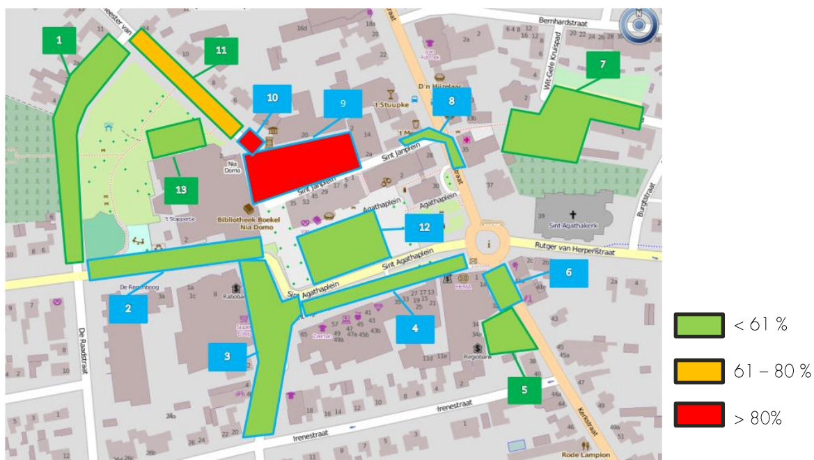
Abbeelding 3 Bezettingsgraad per deelgebied op basis van tellingen vrijdagavond 17 november 20:30 uur