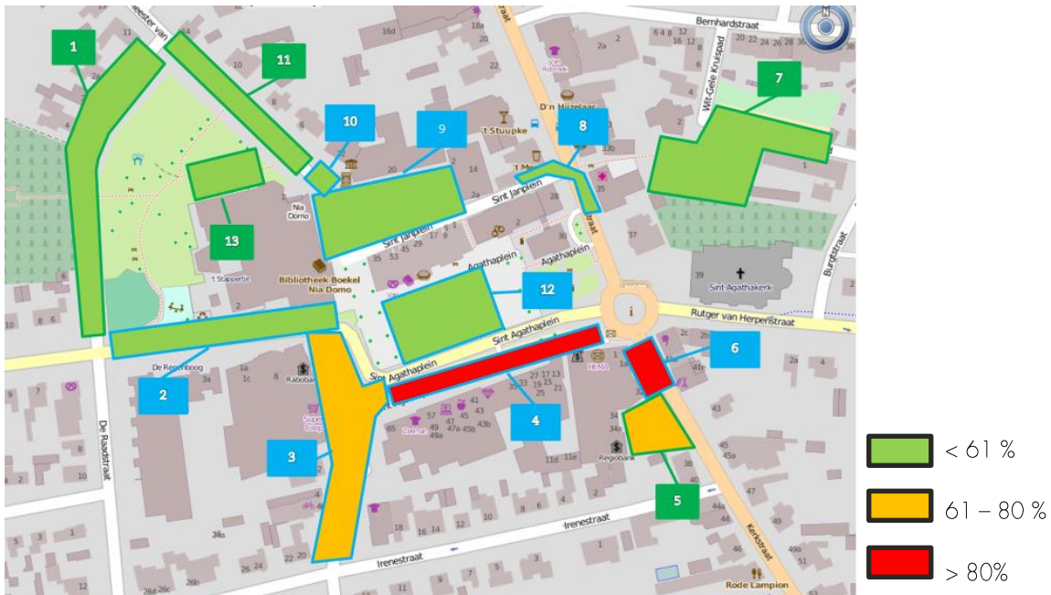
Afbeelding 4 Bezettingsgraad per deelgebied op basis van tellingen zaterdag 18 november 11:00 uur

Op zaterdag zijn met name de gebieden in de blauwe zone nummer 3,4 en 6 druk bezet. Verder is ook langparkeer gebied 5 goed bezet. Het drukste moment van de drie tellingen op zaterdag is 11:00 uur. Op dit moment is een bezetting van 72, 89, 75 en 100% zichtbaar. De overige gebieden en dan met name de langparkeer gebieden hebben een lage bezettingsgraad. De gebieden 4 en 5 zijn overigens ook al de drukst bezette gebieden om 10.00 uur en om 14.00 uur. Om 14.00 uur hebben ze een bezettingsgraad van 96 en 67%.