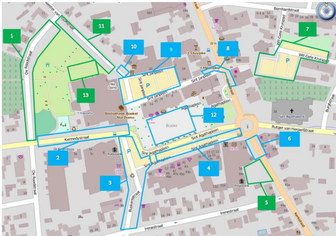
Afbeelding 1 Onderzoeksgebied parkeerdrukmeting

Onderstaand in figuur 1 zijn de deelgebieden weergegeven. De blauwe vakken zijn de blauwe zones met parkeerschijf maximale parkeertijd 2 uur, groen is parkeren zonder maximale parkeertijd.