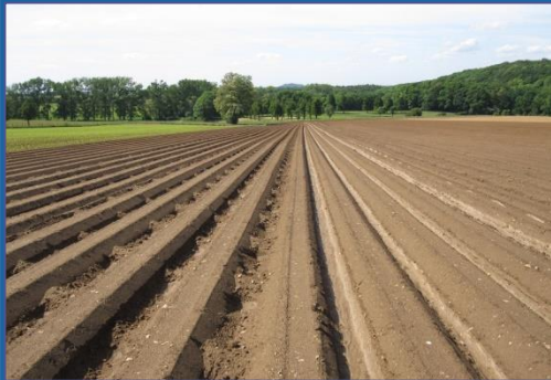
Drempels in ruggenteelt