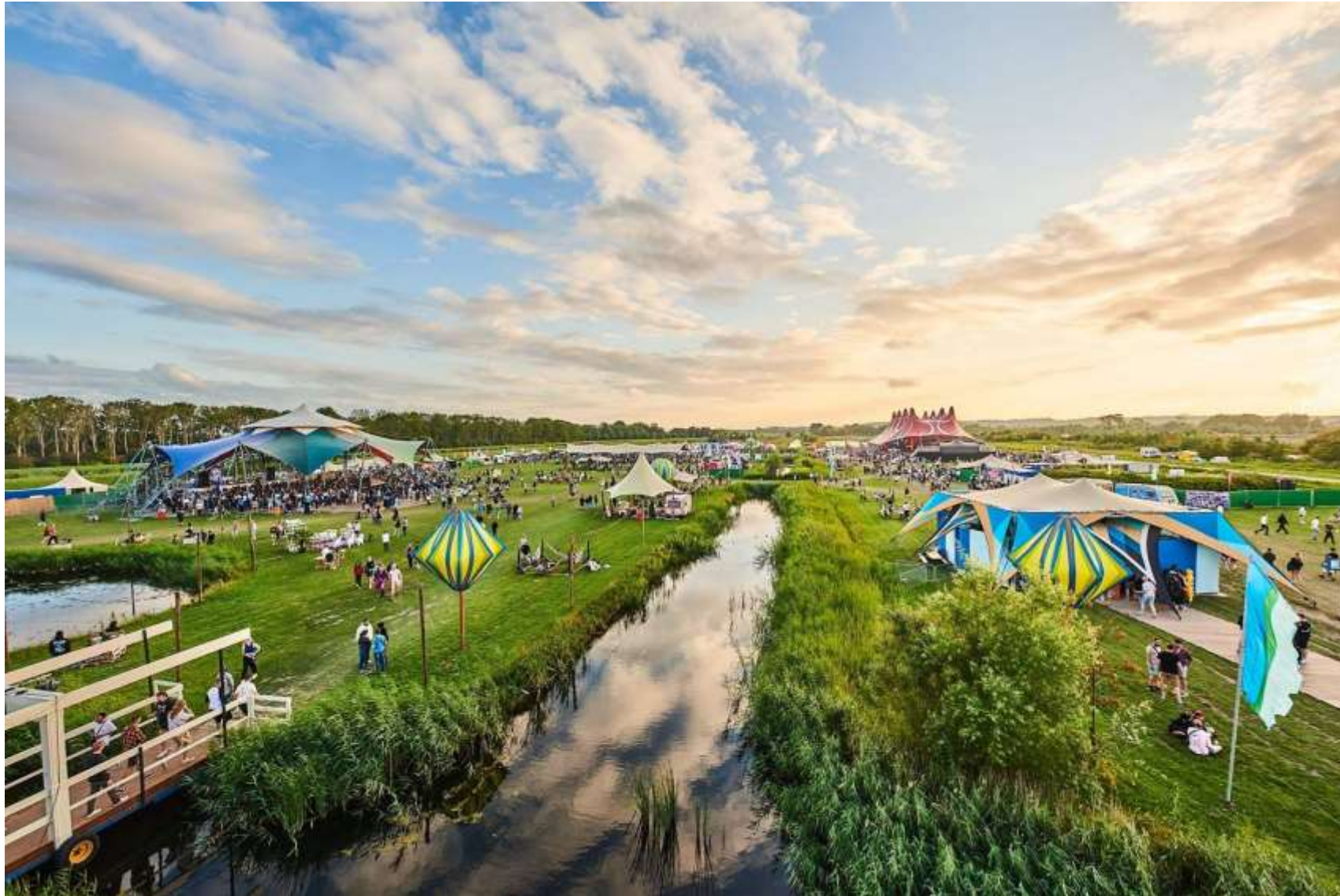
Impressie van het Liquicity-festival