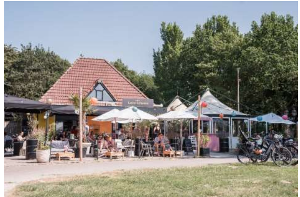
Terras van Lovers & Hunters (Zomerdel-zuid)

Het Uitvoeringsprogramma (UP) is vastgesteld in het AB van 27 juni 2022 en bevat een planning en een raming van de (investerings)kosten en opbrengsten van de geplande activiteiten en ambities.