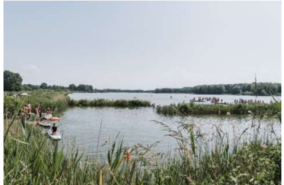
Waterpret bij het strandje (Zomerdal-noord)

Na het uittreden van de provincie heeft het bestuur besloten het jaarlijkse tekort te dekken door een onttrekking uit de bestemmingsreserve. Met het laten opstellen van de visie en het uitvoeringsprogramma willen de participanten zorgen voor een kwalitatieve versterking (natuur en recreatie) van het gebied en een toename van de opbrengsten. Tevens worden financieringsmogelijkheden en opbrengstmogelijkheden onderzocht om te zorgen voor een structureel sluitende meerjarenbegroting. De huidige reserves zijn tot en met 2027 nog voldoende mits op korte termijn de begroting meerjarig in evenwicht wordt gebracht. En daarvoor is de geplande uitvoering van het UP onontbeerlijk.