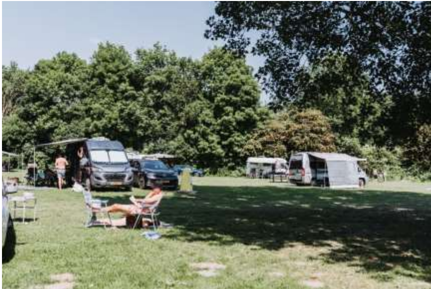
Dagkampeerterrein bij Zomerdel-zuid.