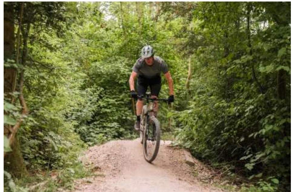
Mountainbiken op het mtb-parcours

Met het oog op maatschappelijke werkvoorziening wordt een post van € 51.000 opgenomen voor structurele inhuur van werknemers vanuit de sociale werkvoorziening.