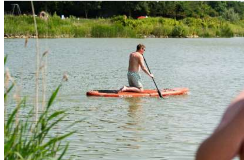
Suppen op de Zomerdel

Uiteindelijk ging het fonds op in de bestemmingsreserve exploitatie, waar later, na uittreding, ook de afkoopsom van de Provincie Noord-Holland en van de bijdragen voor tien jaar van de gemeenten Schagen en Bergen aan zijn c.q. worden toegevoegd.