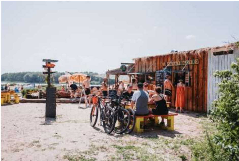
Buitenterras El Chiringuito (Zomerdel – noord)