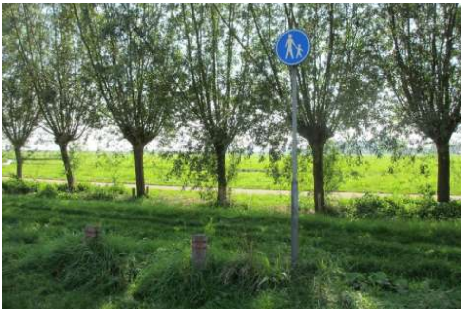
Figuur 7 Voetpad bij parkeerplaats De Hoorne