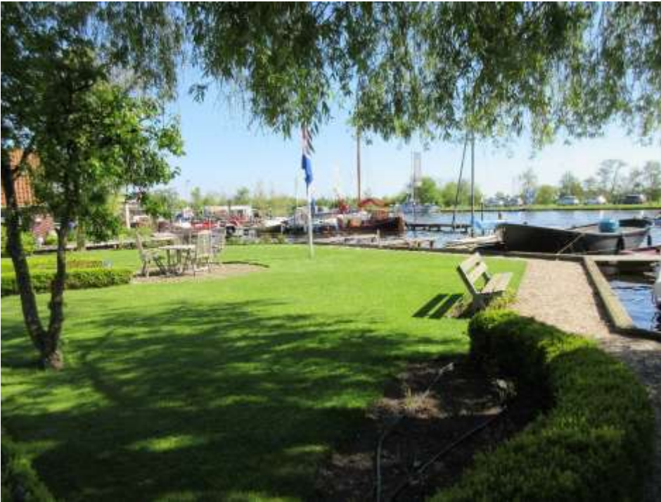
Figuur 8 uitzicht over het haventje De Woude

Bij de laatste activiteit is het advies van de functionaris voor de gegevensbescherming belangrijk. Met proceseigenaren zal vervolgens een keuze gemaakt worden voor de toe te passen ordening waarmee we beter kunnen voldoen aan de Woo.