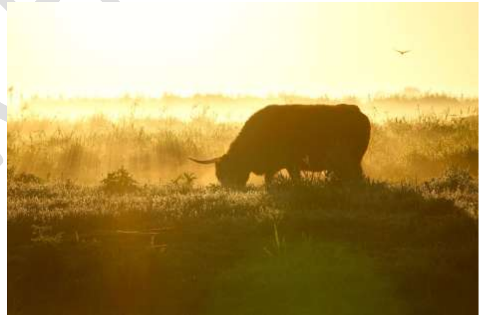
Figuur 6 Schotse hooglandeer met fazant in Dorregeesterpolder

Het personeel van de uitvoeringsorganisatie is niet in dienst van het recreatieschap, maar in dienst van Recreatie Noord-Holland NV, waardoor dit indexatiecijfer niet van toepassing is op de 'inzet RNH'. De vooralsnog gehanteerde index op de uurtarieven van RNH voor 2027 is 4%.