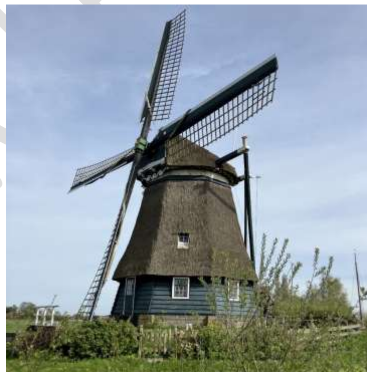
Figuur 2 Dorregeestermolen bij Akersloot