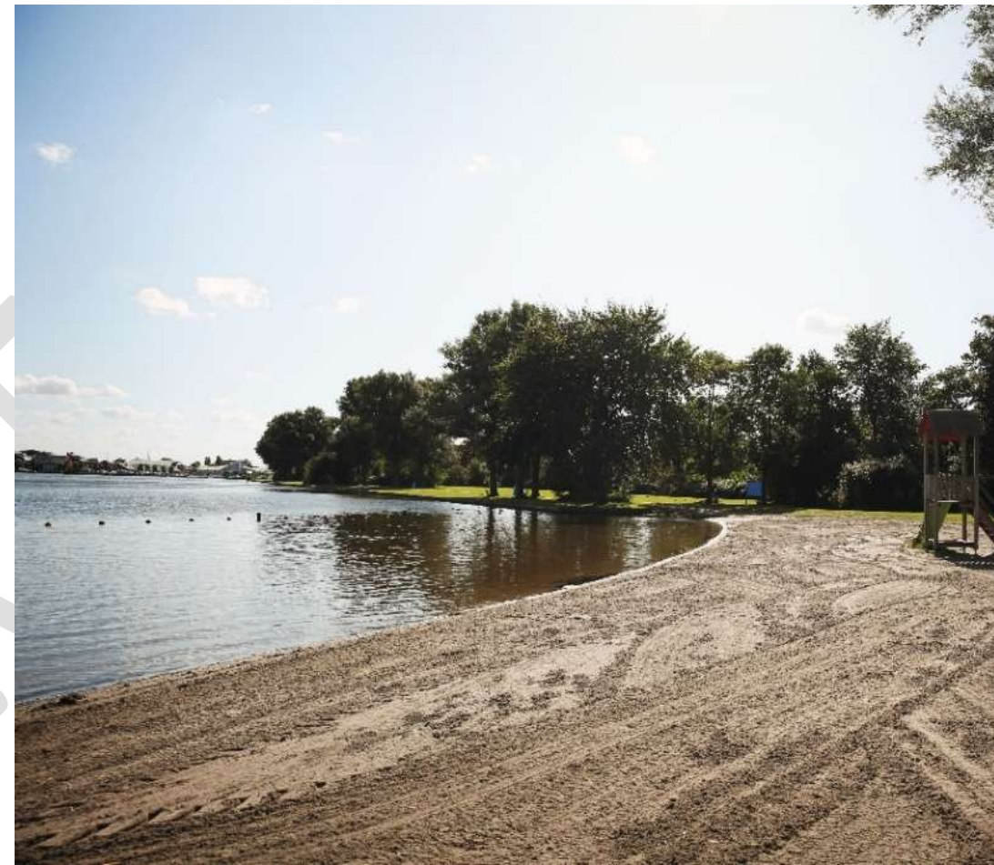
Figuur 3 Net aangelegd strand - Dorregeest