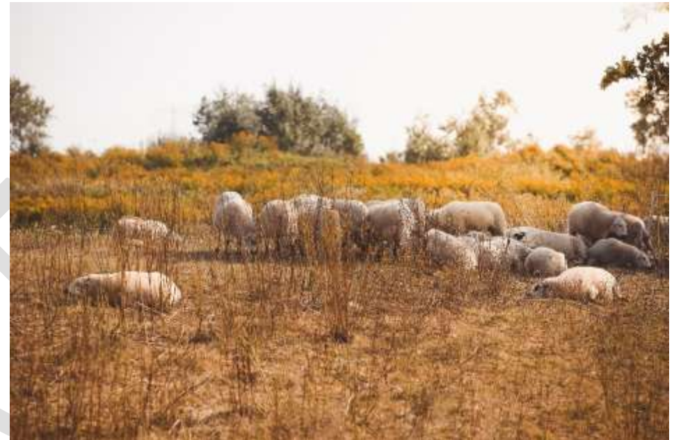
Figuur 9 Grazende schapen bij Aagtenpark