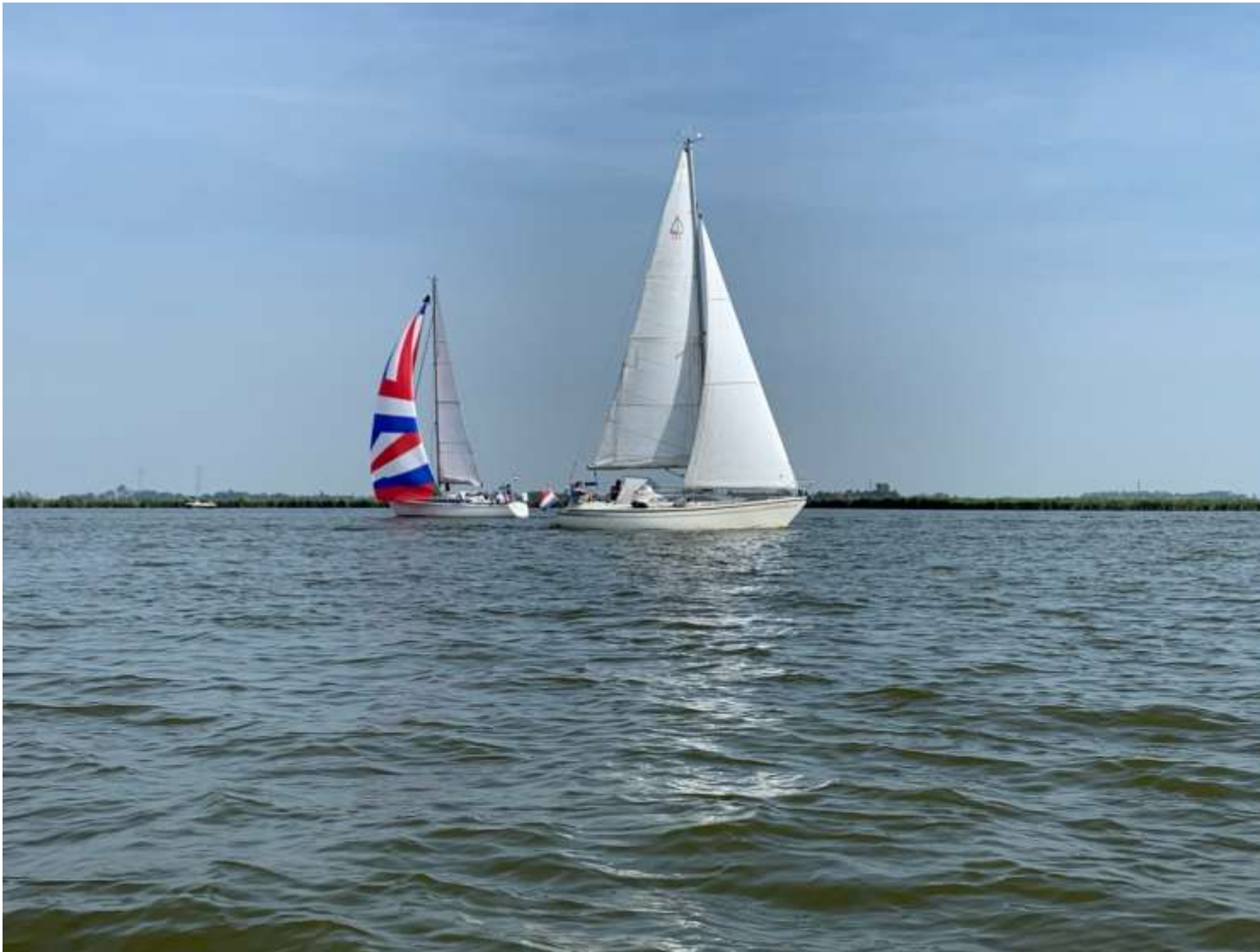
Figuur 4 Kruisende zeilboten op het meer