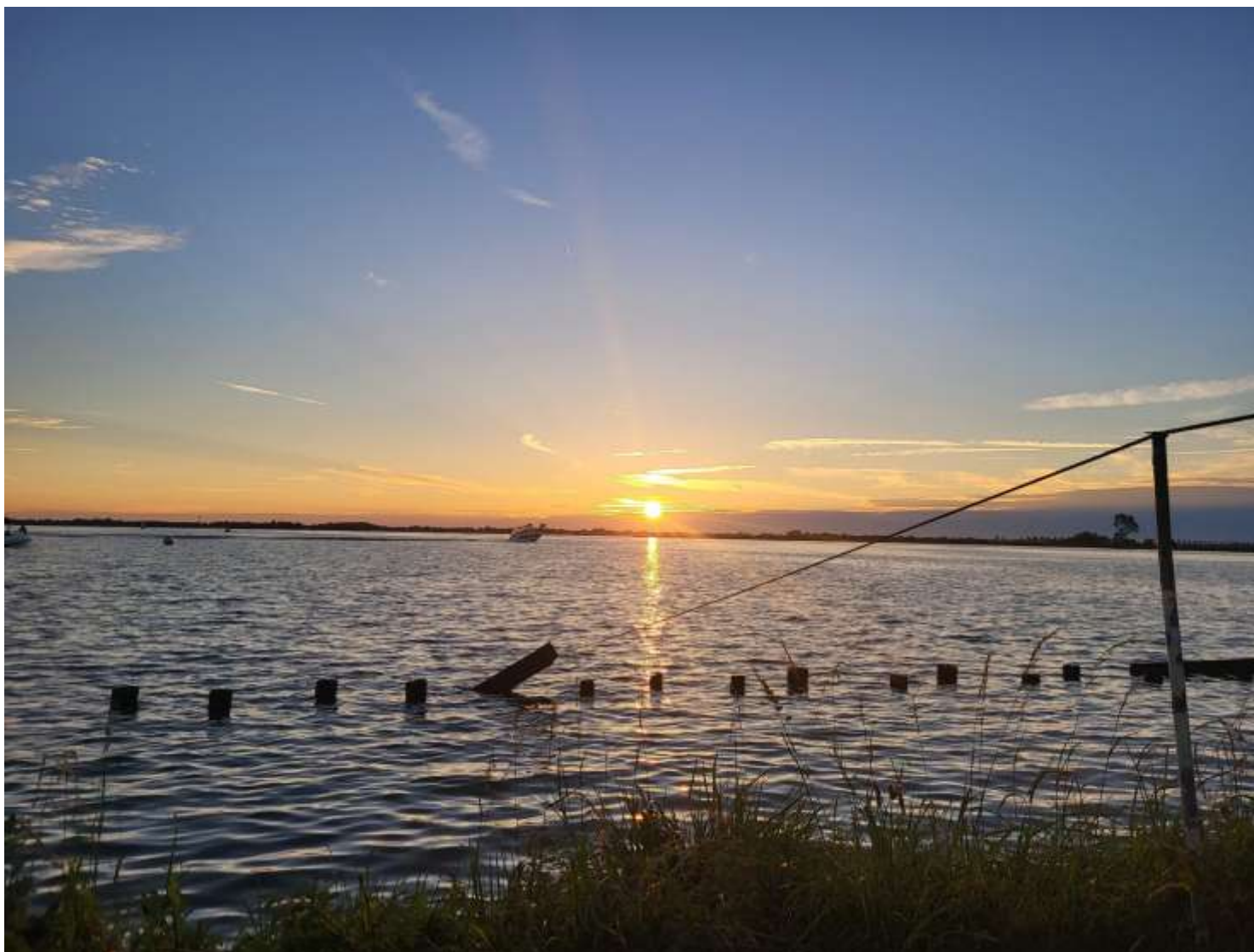
Figuur 5 Uitzicht vanaf De Woudhaven bij avondzon