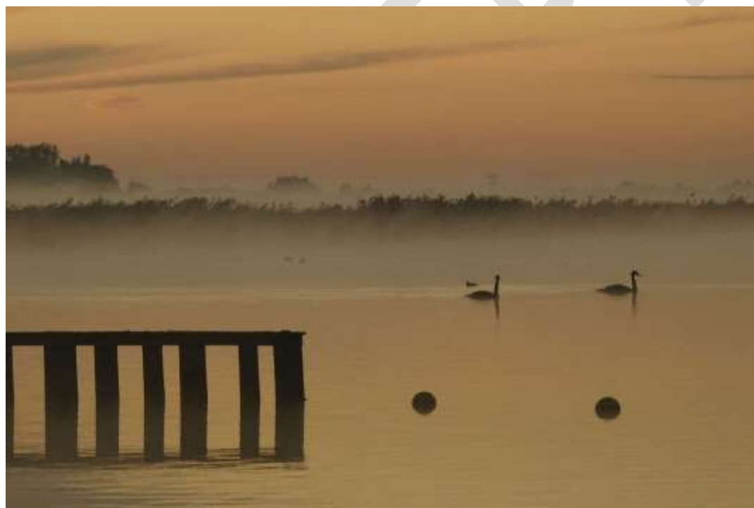
Figuur 1 Avondzon aan de rand van het meer