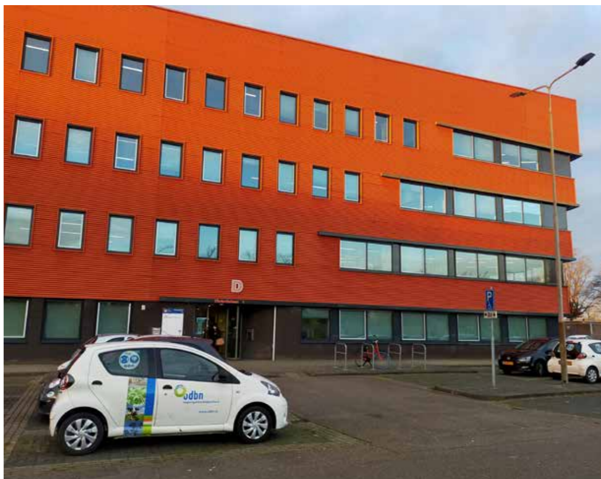
Meebewegen in een beweeglijke leefomgeving