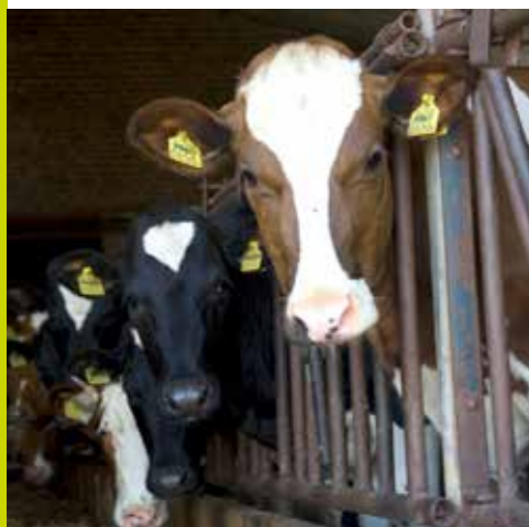
Meebewegen in een beweeglijke leefomgeving

Een belangrijk neveneffect van IGW is een verbetering van onze informatiepositie. Daarom gaat IGW een grote rol spelen in de overgangperiode van het oude recht naar het nieuwe recht. Zo zullen onze medewerkers aanvankelijk gebruik moeten maken van informatie uit het inrichtingenbestand, omdat we niet meteen bij inwerkingtreding van de Omgevingswet zullen beschikken over een totaaloverzicht van de milieubelastende activiteiten (MBA's) in onze regio. Het IGW kan een belangrijke ondersteunende rol spelen in deze overgangperiode door de datastromen goed aan elkaar te koppelen. De komende jaren blijven we als ODBN investeren in de ontwikkeling van het IGW. Door data slimmer te analyseren kunnen we onze VTH-taken effectiever en efficiënter uitvoeren. We krijgen meer grip op onze leefomgeving en kunnen ook onze impact op de leefomgeving steeds beter in kaart brengen.