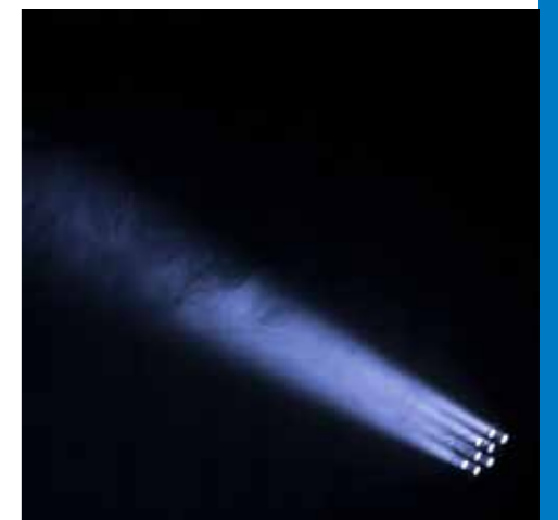
ODBN Programmabegroting 2023

Sinds enkele jaren wordt intensiever werk gemaakt van verzuimbegeleiding. We zien dat in de aard van het verzuim ook terug. Een lage frequentie en weinig kort verzuim maar daar staat helaas tegenover dat we te maken hebben met enkele individuele ziektegevallen met een langer verloop. COVID-19 en chronische ziektebeelden kunnen we niet beïnvloeden. We continueren de intensieve begeleiding en blijven streven naar een maximaal verzuimpercentage van 5,5%. In het sociaal jaarverslag zal hier verder op worden ingegaan. In het laatste deel van 2021 zien we dat het verzuim als gevolg van COVID-19 iets is toegenomen. In 2021 is het ziekteverzuim iets hoger geweest dan 5,5%. In de begroting wordt met een norm gewerkt van 5,5%, het streven is het verzuimpercentage zo laag mogelijk te houden.