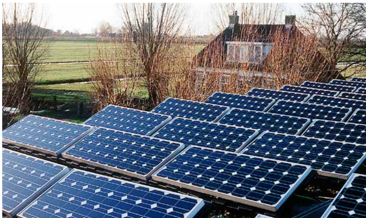
Meebewegen in een beweeglijke leefomgeving