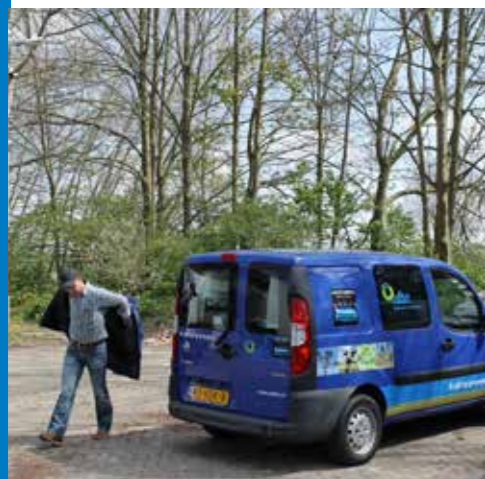
Meebewegen in een beweeglijke leefomgeving

Dit heeft ook gevolgen voor de ODBN en onze gemeenschappelijke regeling. Zo is sprake van wijzigingen en uitbreidingen in de zienswijzeprocedure, kan een gemeenschappelijke adviescommissie worden ingesteld en geldt een actieve informatieplicht van de gemeenschappelijke regeling naar betrokken gemeenteraden. Onze gemeenschappelijke regeling moet daarvoor worden gewijzigd. Ambtelijk worden hiervoor voorbereidingen getroffen en ook de raden worden nauw betrokken bij dit proces, dat samen met andere gemeenschappelijke regelingen in de regio doorlopen kan worden.