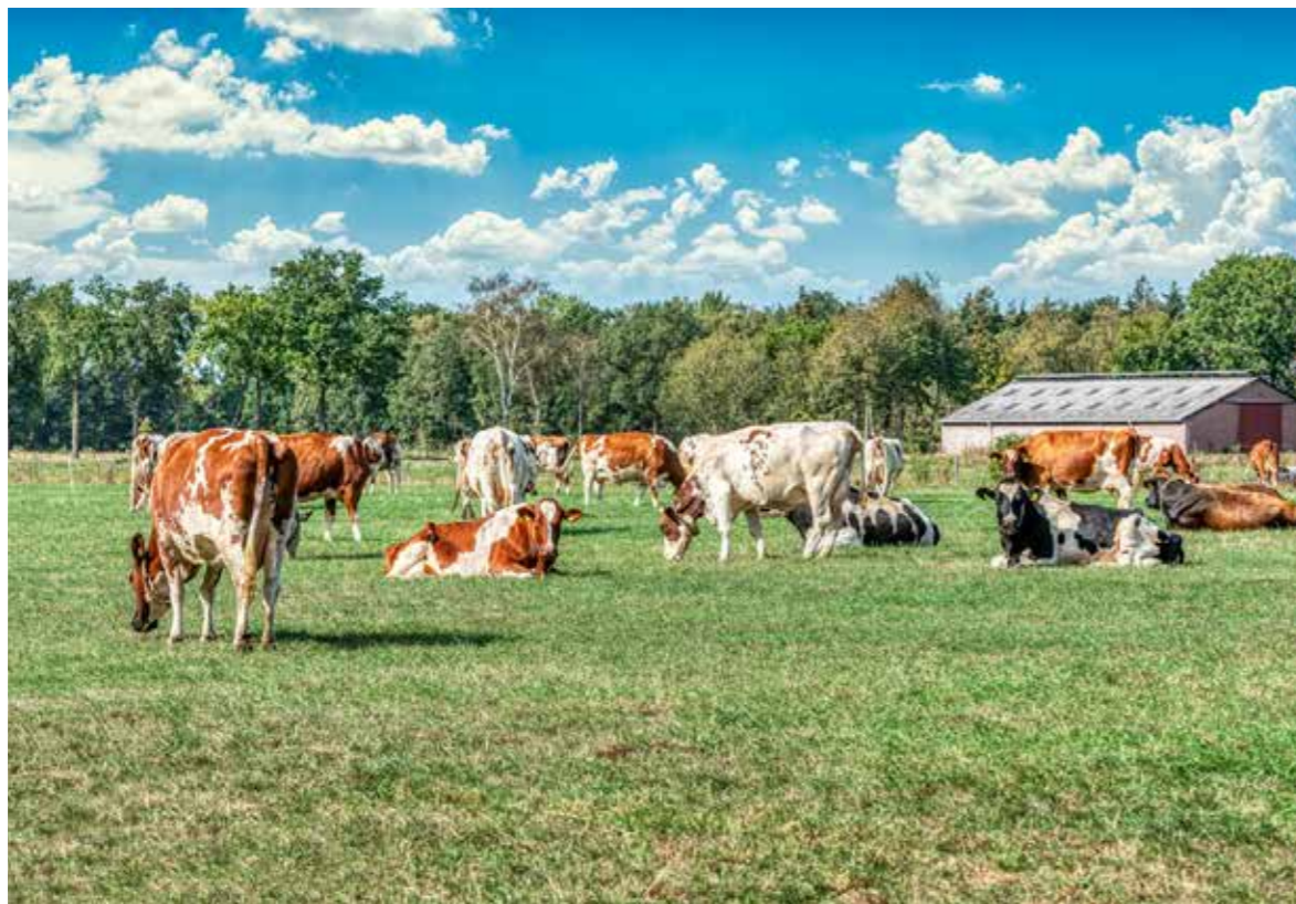
Meebewegen in een beweeglijke leefomgeving