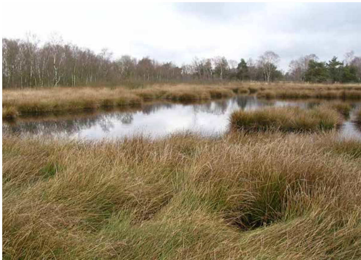
Meebewegen in een beweeglijke leefomgeving

De ODBN heeft op dit moment geen leningen met een looptijd van één jaar of langer. Hiermee voldoen wij automatisch aan de deze renterisico-norm. Ook geeft de huidige financieringspositie geen aanleiding om in de komende jaren langlopende geldleningen af te sluiten, zodat we in dat kader ook geen renterisico lopen.