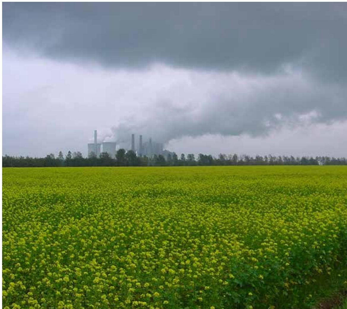
Meebewegen in een beweeglijke leefomgeving