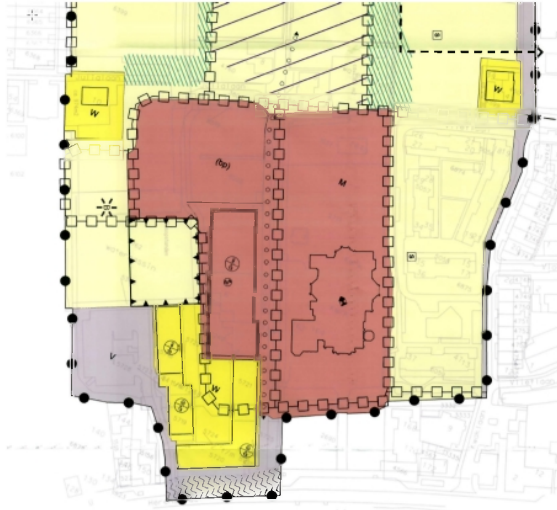
Uitsnede bestemmingsplankaart Julianahof