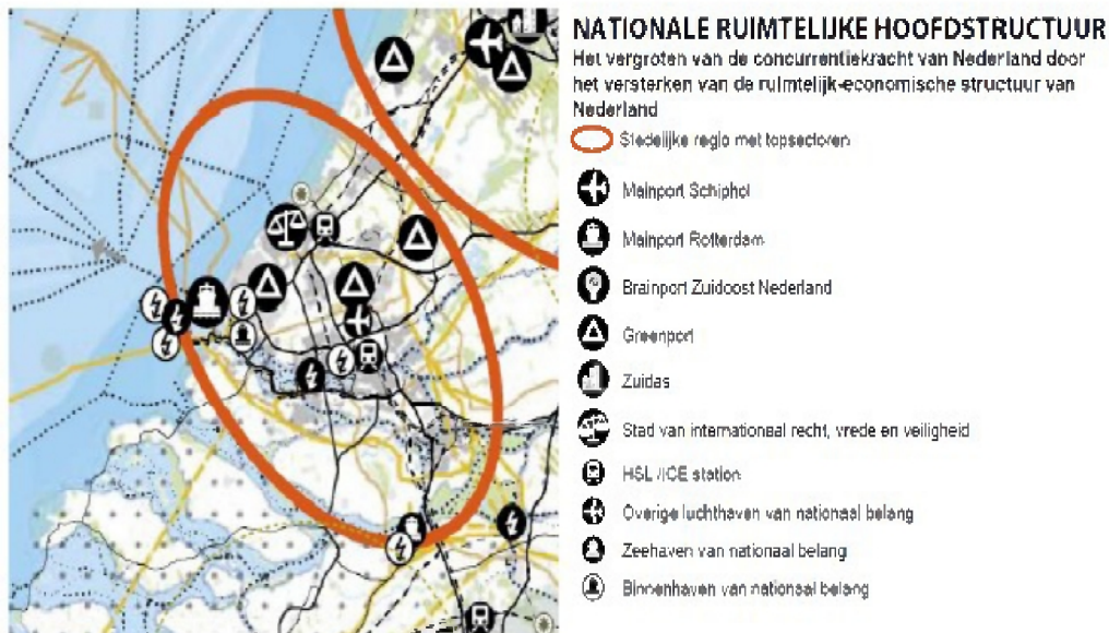
Figuur - Uitsnede kaart nationale ruimtelijke hoofdstructuur

Het Westland is op de kaart van de nationale ruimtelijke hoofdstructuur aangewezen als Greenport.