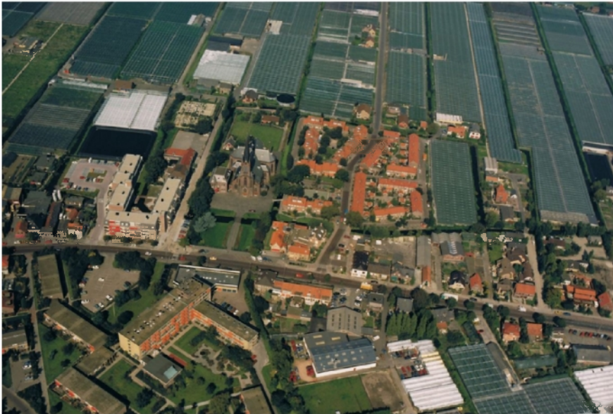
De omgeving van het plangebied voor de realisatie van de nieuwbouwwijk Julianahof

linten gegroeid. Centraal door het dorp loopt de Dorpskade, waardoor een heldere rasterstructuur van woonbuurten is ontstaan. De buurten hebben een herkenbare karakteristiek, afhankelijk van de periode waarin ze ontworpen zijn.