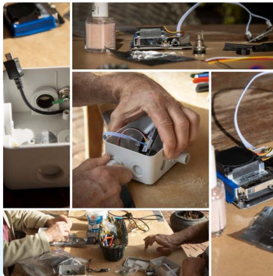
De werkgroepleden van SMM hebben het afgelopen jaar zo'n 140 meetsensoren gebouwd. Het bouwen van één sensor uit zo'n 25 aparte onderdelen duurt ongeveer 75 minuten.

Meer informatie over Samen Meten Meierijstad, de meetresultaten en het jaarverslag zijn te vinden op www.samenmetenmeierijstad.nl . <