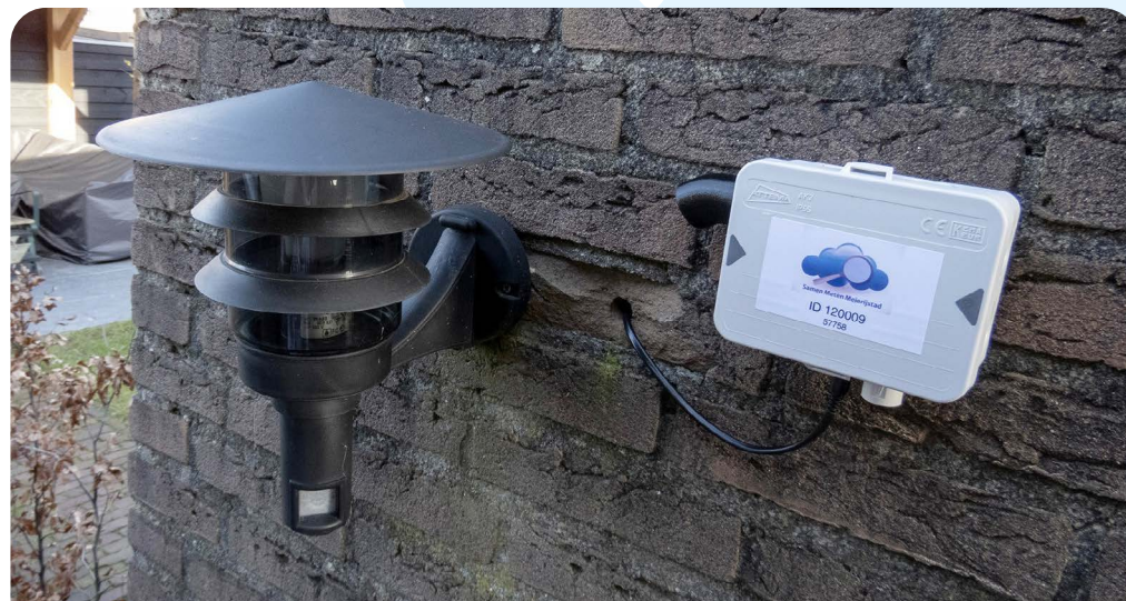
Een meetsensor van SMM aan de gevel.

‘Er hangen er ongeveer 130 sensoren verspreid over de verschillende kernen van Meierijstad (niet elke aangeschafte sensor is op het ogenblik actief). Niet elke dorpskern (totaal 13 in Meierijstad) heeft evenveel sensoren. Zo willen wij graag in Earde wat meer sensoren, en ook in de buurt van snelwegen.’