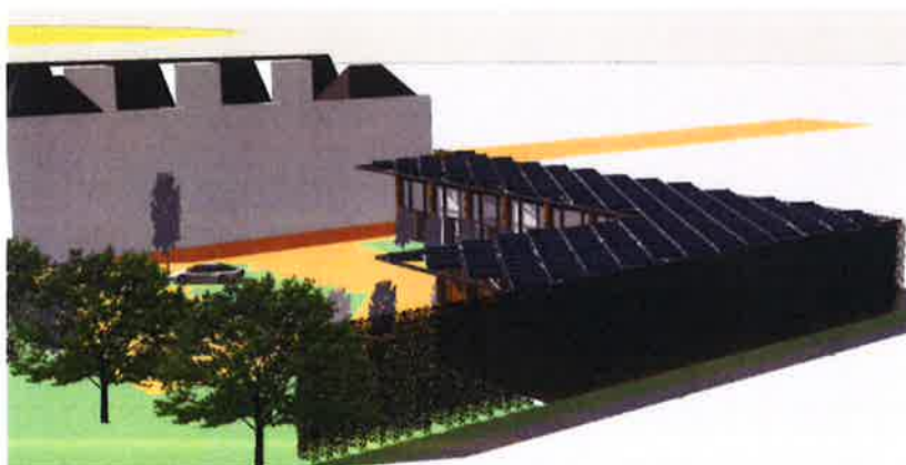
Ontwerp gezien vanuit de achterzijde van het perceel. Het dak van de 11 appartementen wordt volledig voorzien van zonnepanelen. De achtergevels zijn blinde én groene gevels.