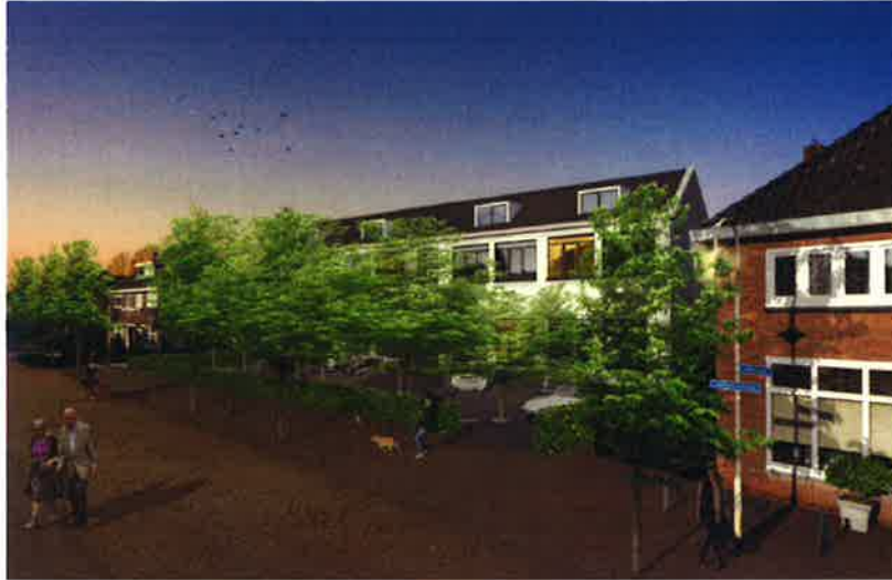
Schetsontwerp voorkant woningbouwproject The School