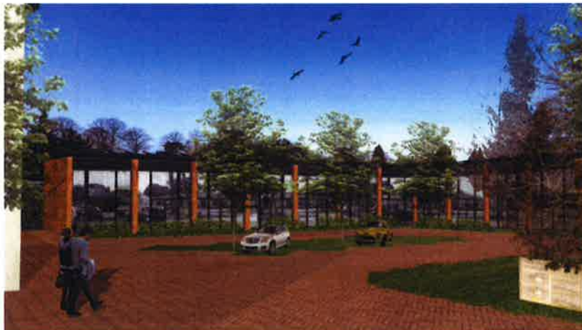
Ontwerp van de 11 appartementen op het achterterrein