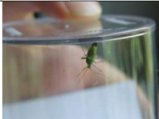
26/05, mediterrane prachtblindwants , keuken Syriësingel, Aukje Gjaltema.