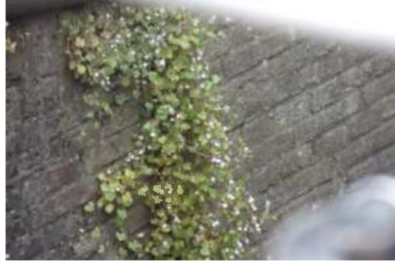
27/05, muurleeuwenbek , Voorstraat, Delft, Freek Boon.