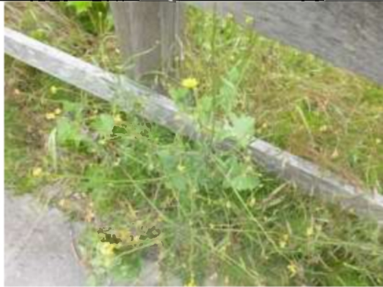
18/05, biggenkruid , van Weerden Poelmanpad, Jos van Koppen.