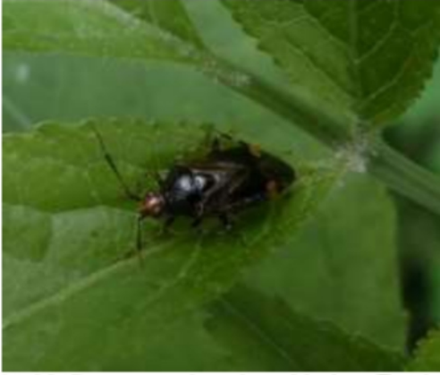
01/06, Deraeocoris ruber , Marian, Tanthof