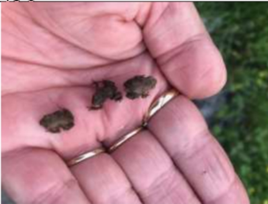
30/05, jonge padden , Sportlaan Pijnacker, Karin Flier.