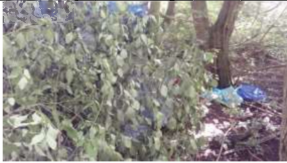
Illegale tent, Delft Zuid