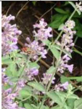
25/05, muntvlinder , Hillenlaan, Delft, Annalies.