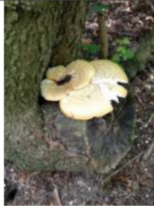
22/05, zadelzwam , Delftse Hout, Annalies.