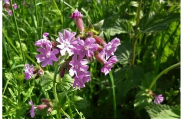
09/05, dagkoekoeksbloem , van Weerden Poelmanpad, Jos van Koppen.