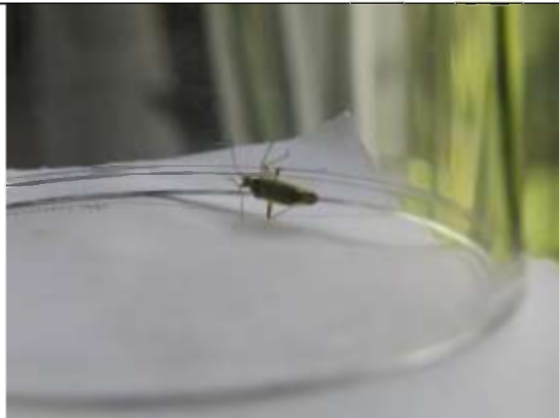
26/05, mediterrane prachtblindwants , keuken Syriësingel, Aukje Gjaltema.