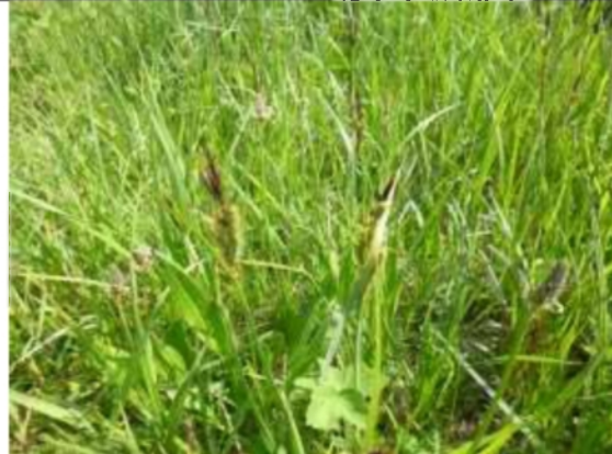
09/05, zegge , van Weerden Poelmanpad, Jos van Koppen.