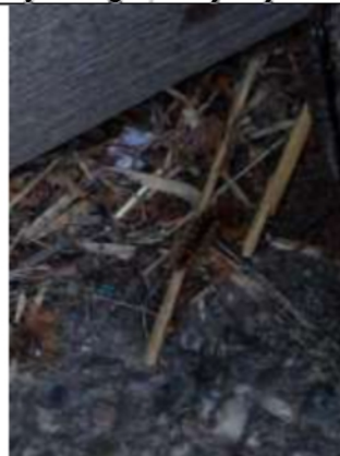
27/05, rups bastaardsatijnvlinder , hoeve Biesland, Annalies.