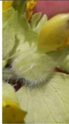
3/6, harige ratelaar, Delft Zuid