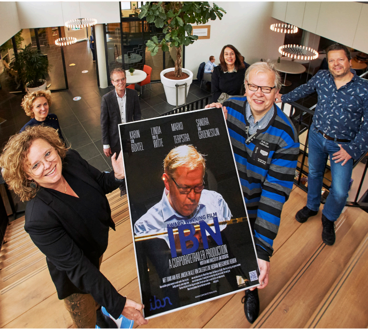
IBN ontving de speciale 'award-filmposter' die voor deze gelegenheid werd gemaakt.