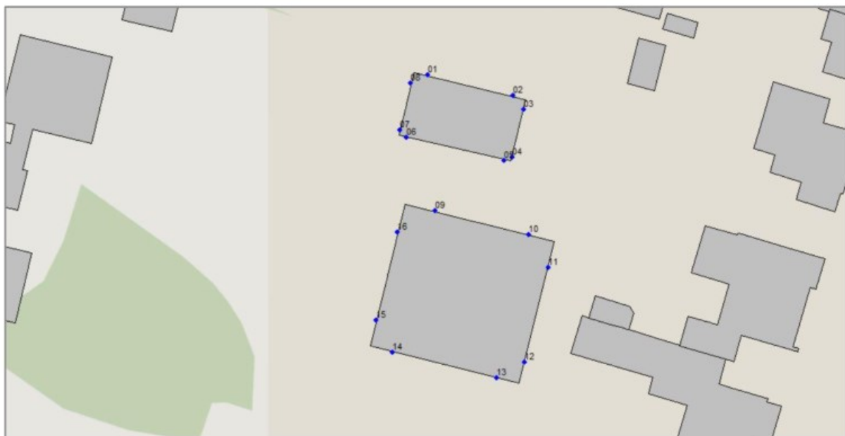
Figuur 3.1 bouwvlakken met toetspunten

Voor het plangebied is reeds een tekening opgesteld met de projectie van de bouwvlakken. Voor elke zijde van de bouwvlakken zijn toetspunten ten behoeve van maximaal 3 bouwlagen gemodelleerd. Voor het onderzoek is een standaard bodemfactor van 0,5 (half hard half zacht) gehanteerd. Aanvullend wordt ter plaatse van harde ondergrond (wegen en voetpaden) rekening gehouden met een hard bodemgebied (factor 0,0). In figuur 3.1 zijn de woningen met de situering van de toetspunten weergegeven.