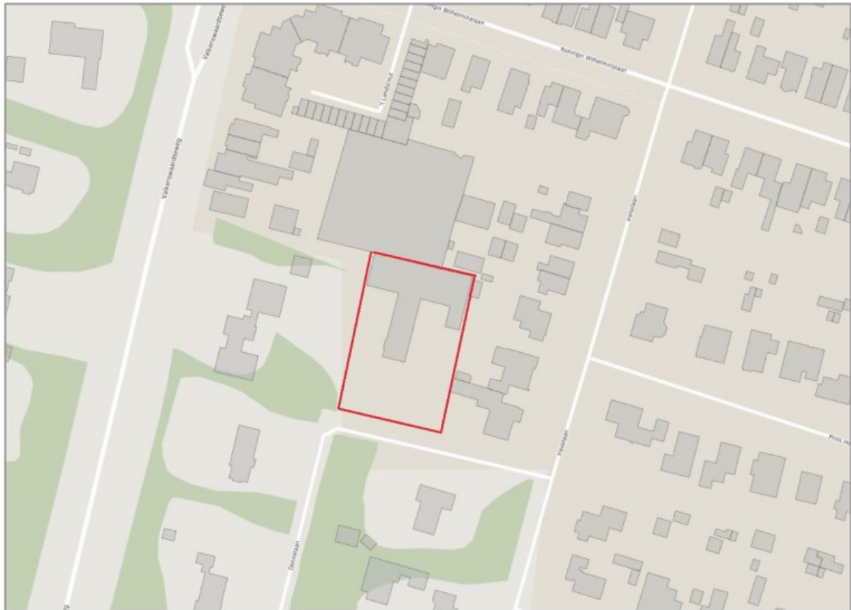
Figuur 1.1 Situering onderzoeksgebied

De initiatiefnemer heeft het voornemen de bestemming 'kantoor' aan de Dennelaan 1-1A te Waalre te wijzigen naar 'wonen'. Het perceel zal gesplitst worden waarna twee nieuwe woningen worden gerealiseerd. Het vigerende bestemmingsplan staat de beoogde ontwikkeling niet toe. Om af te wijken van het vigerende bestemmingsplan heeft Econsultancy voor de bestemmingsplanwijziging een akoestisch onderzoek wegverkeerslawaaï uitgevoerd. In figuur 1.1 is een globale situering van het onderzoeksgebied weergegeven.