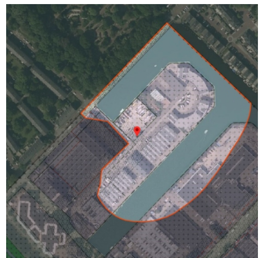
Gebiedsaanduiding 'geluidzone – industrie'