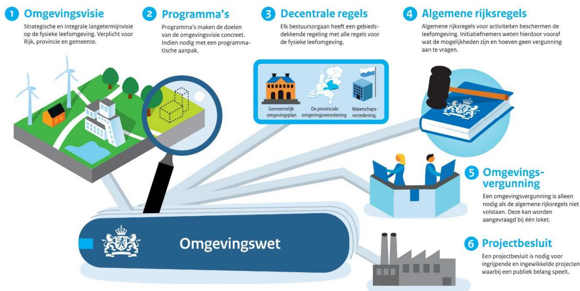
Figuur 1 De zes nieuwe instrumenten van de Omgevingswet

De gemeente kan met de omgevingsvisie, programma's, het omgevingsplan en de omgevingsvergunning sturen op de fysieke leefomgeving. De Omgevingswet schrijft niet voor op welke wijze participatie bij het opstellen van deze instrumenten plaats moet vinden. In de aard van de wet ligt echter besloten dat de maatschappij een grote(re) rol, vroeg in het proces zal moeten krijgen. Dit kan in de vorm van een omgevingsdialoog.