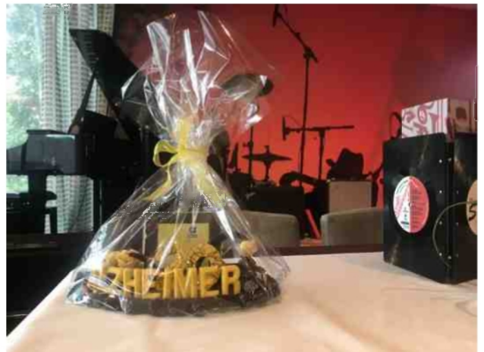
Een mooi, leuk en lekker kado van Alzheimer Nederland