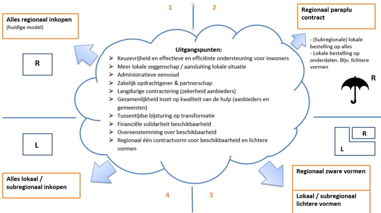
Figuur 2: Vier inkoopscenario's inkoop jeugdhulp 2020 en verder

Naar aanleiding van de evaluatie zijn er bestuurlijke uitgangspunten geformuleerd. Op basis hiervan zijn er vier mogelijke scenario's uitgewerkt. Deze vier scenario's zijn weergegeven in figuur 2.