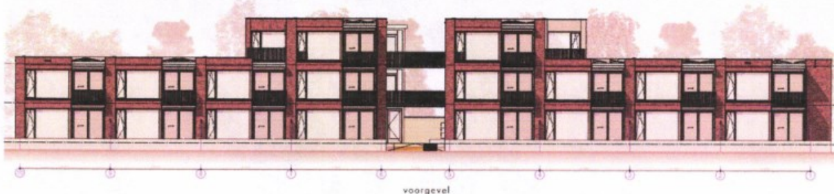
Impressie voorgevel appartementen

Het appartementengebouw bestaat overwegend uit 2 bouwlagen in aansluiting op de omliggende woonbebouwing. Alleen centraal op het gebouw worden 3 bouwlagen gerealiseerd. De vrijstaande woning bestaat uit maximaal 2 bouwlagen. Achter op het perceel, ten westen van de vrijstaande woning, komen de benodigde bergingen voor de appartementen. Deze bestaan uit 1 bouwlaag. Op navolgende afbeeldingen een impressie van de bouwmassa's (Bron: beusen architecten bv, d.d. 16 mei 2022 & 23 mei 2022):