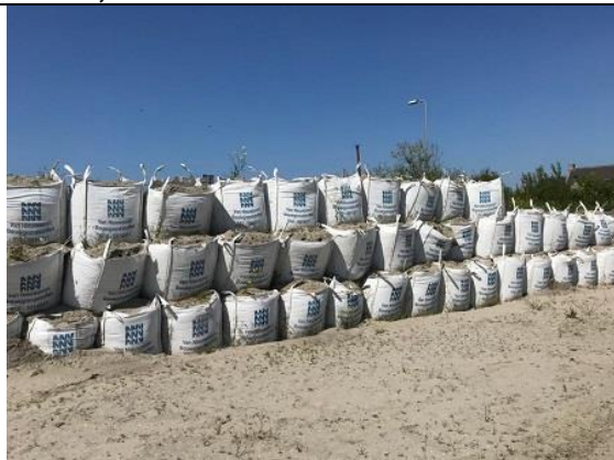
09/05, gebruikt door oeverzwaluwen , Veilingweg/Blakervaart, De Lier