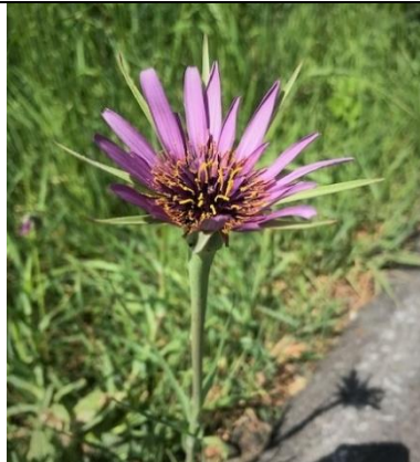
08/05, paarse morgenster , Abtswoude, Bruun vd Steuijt.