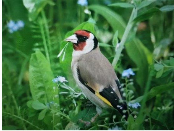
06/05, putter , Tanja.