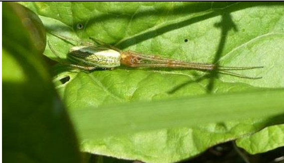
05 05, strekspin , Den Hoorn, Willemein Poot.