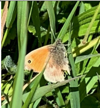
05/05, hooibeestje , noodwaterberging van de Woudse polder, Margreet Hogeweg.