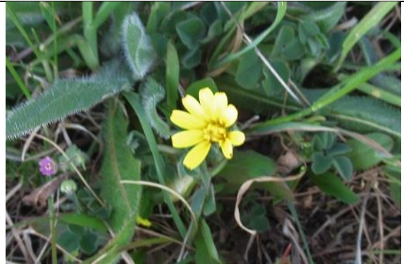
02/05, gewoon biggenkruid , langs fietspad A13, Jos van Koppen.