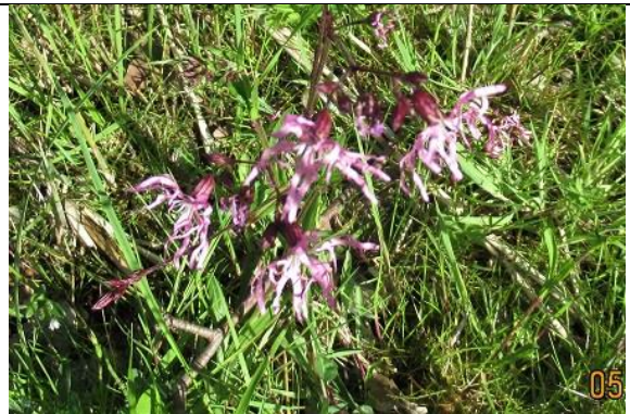
04/05, echte koekoeksbloem , Vrederustpad, Jos van Koppen.