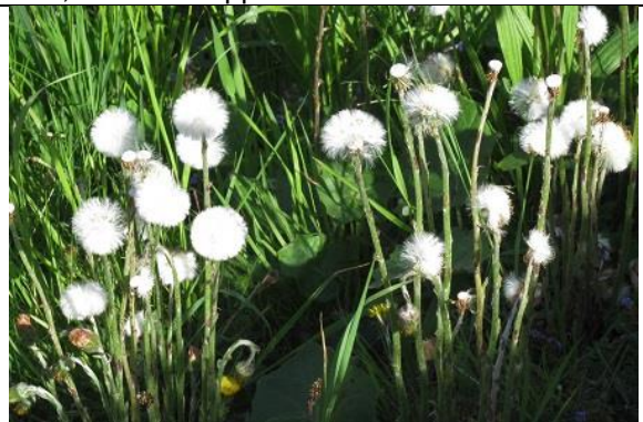
03/05, klein hoefblad pluus, Van Weerden Poelmanpad, Jos van Koppen.