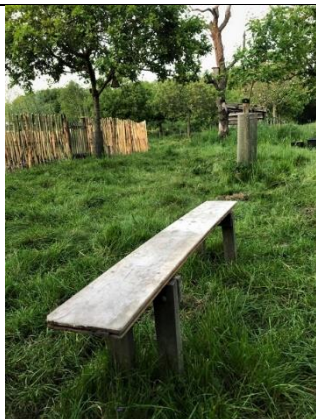
Bankje boomgaard Veelust.