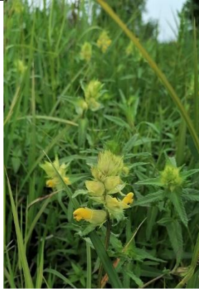
06/05, grote ratelaars , in Ruyven, Karitaatmolenpad, Pieter Brugveen, Delft.