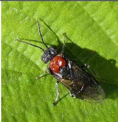
05/05, Eriocampa ovata op zwarte els, Den Hoorn, Willemein Poot.