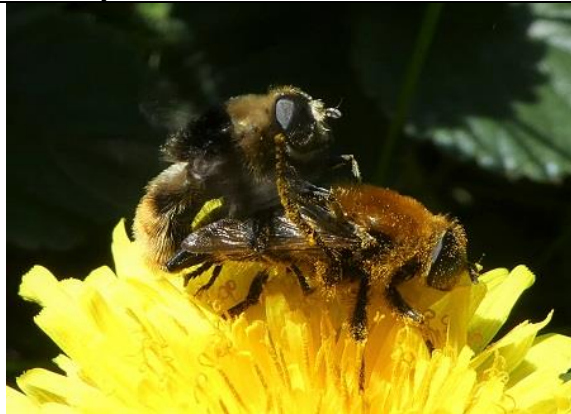
07/05, grote narcisvliegen in de maak, Den Hoorn, Willemein Poot.