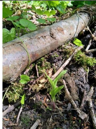
09/05, brede wespenorchis , Catharina Hoekema.