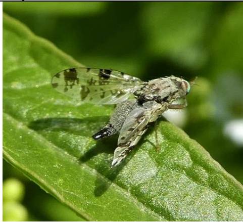
07/05, grijze distelboorvlieg , Den Hoorn, Willemein Poot.