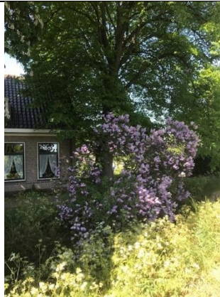
09 05 bloeiende sering , Abtswoude, Bruun vd Steuijt.