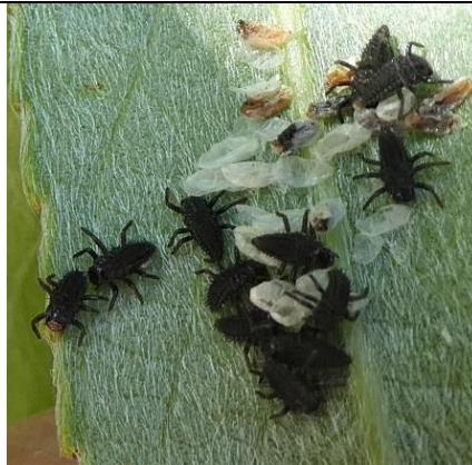
05/05, lieveheersbeestjes net uit het ei , Den Hoorn, Willemein Poot.