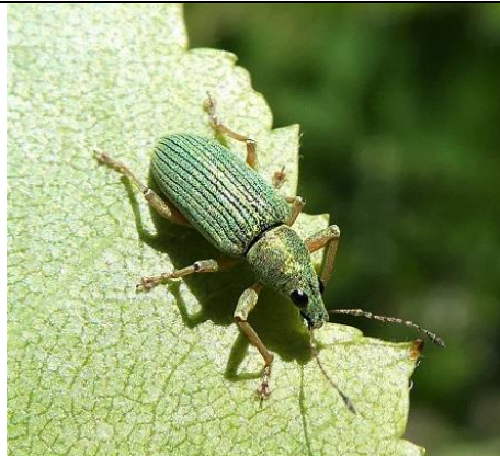
05/05, groene struiksnuitkever , Den Hoorn, Willemein Poot.