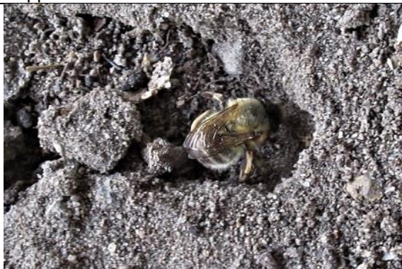
02/05, zandbij , langs fietspad A13, Jos van Koppen.