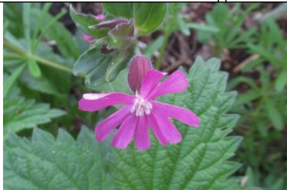
02/05, dagkoekoeksbloem , IIsyplantsoen, Jos van Koppen.

In blok 37-16-31 [IKEA tot Noordeindseweg], langs het Vrederustpad een strook aan de waterkant: echte koekoeksbloem . Jos van Koppen.