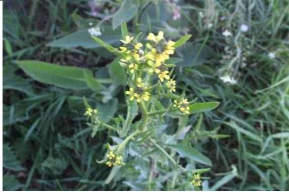
04/05, gewone raket , tankstation, Delfgauw, Jos van Koppen.