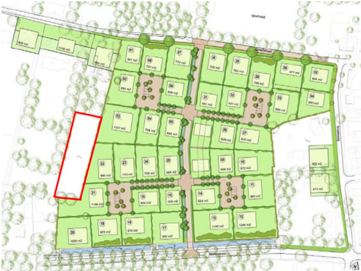
Afbeelding 1.3 Ligging en begrenzing van het plangebied t.o.v. woonbuurt De Smaragd