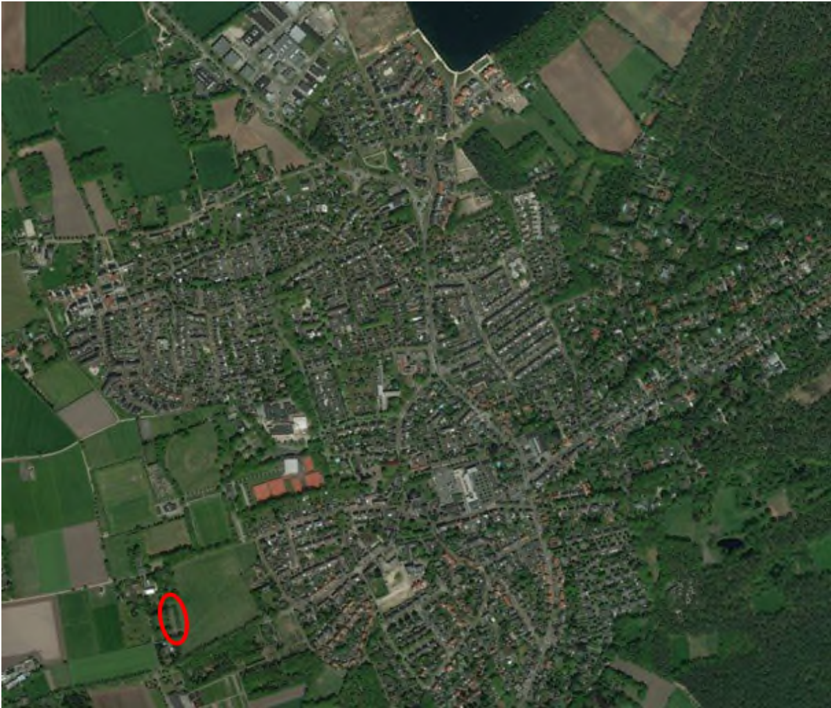
Afbeelding 1.1 Ligging van het plangebied in Waalre