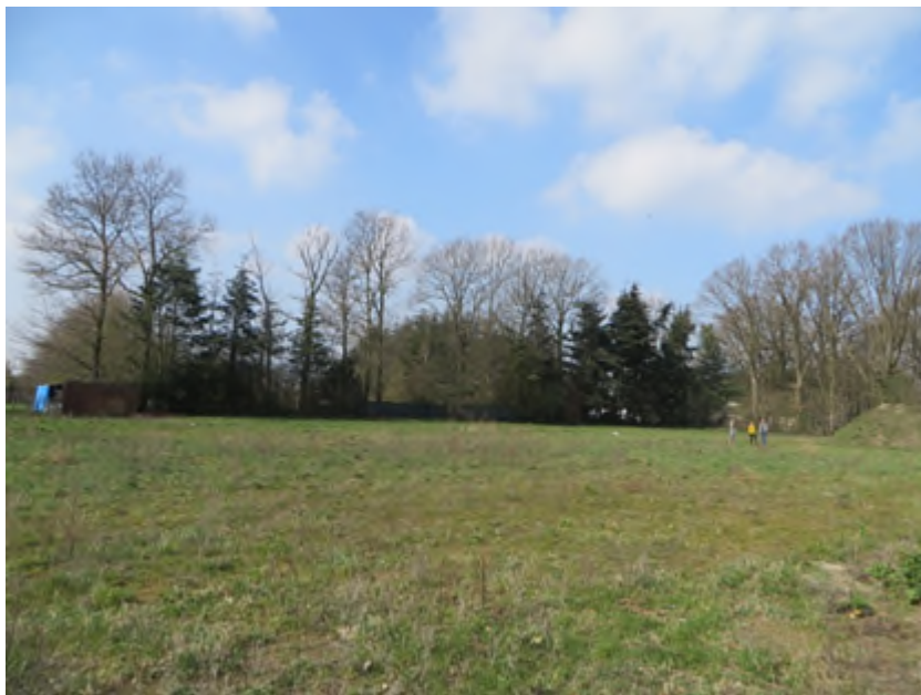
Zicht op de perceelsgrens van het aangrenzende agrarische perceel