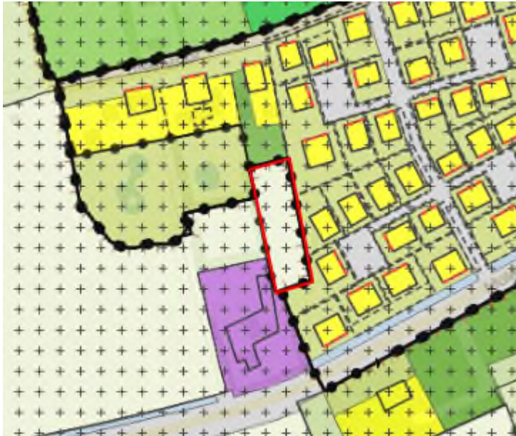
Afbeelding 1.4 Uitsnede geldende bestemmingsplannen van www.ruimtelijkeplannen.nl met links het bestemmingsplan 'Buitengebied Waalre' en rechts het bestemmingsplan 'Molenstraat - Dreefstraat'