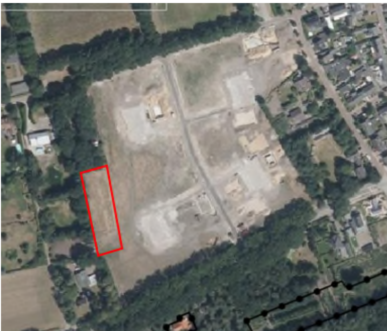
Afbeelding 1.2 Ligging en begrenzing van het plangebied