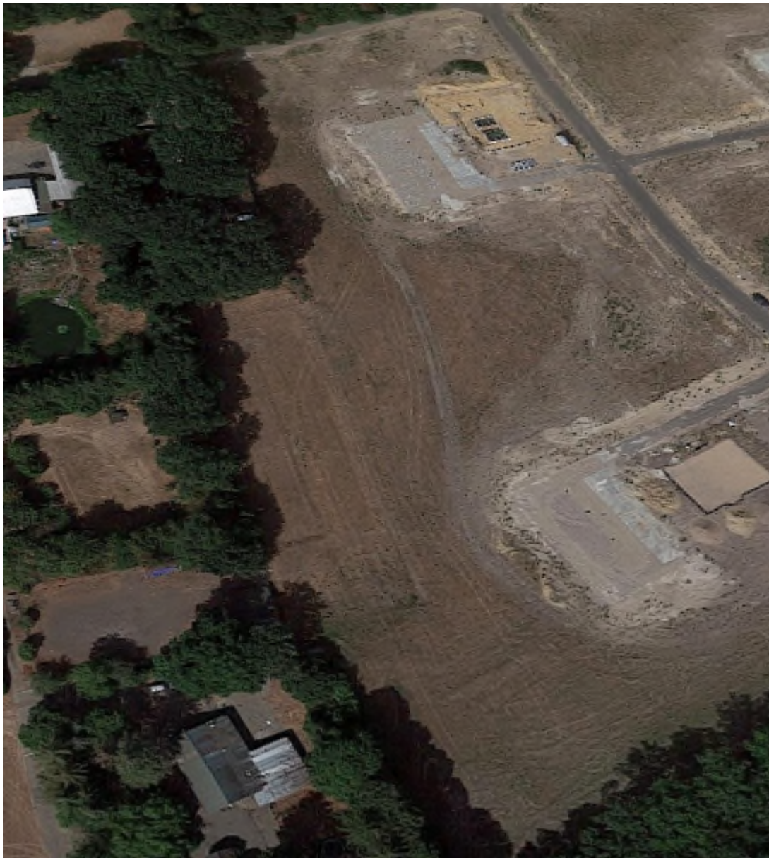
3D overzicht (www.google.maps.nl) huidige situatie

Momenteel bestaat het plangebied uit onbebouwd grasland. Op de percelen die aan de westkant aan het plangebied grenzen, staan hoge bomen met onderbeplanting. Op afbeelding 1.2 en onderstaande beelden is dit duidelijk te zien. Er is hierdoor geen sprake van zicht op het aangrenzende buitengebied.