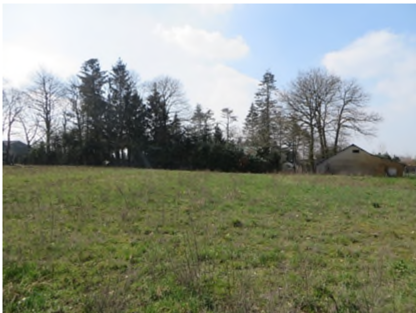
Zicht op de perceelsgrens van het aangrenzende bedrijfsperceel