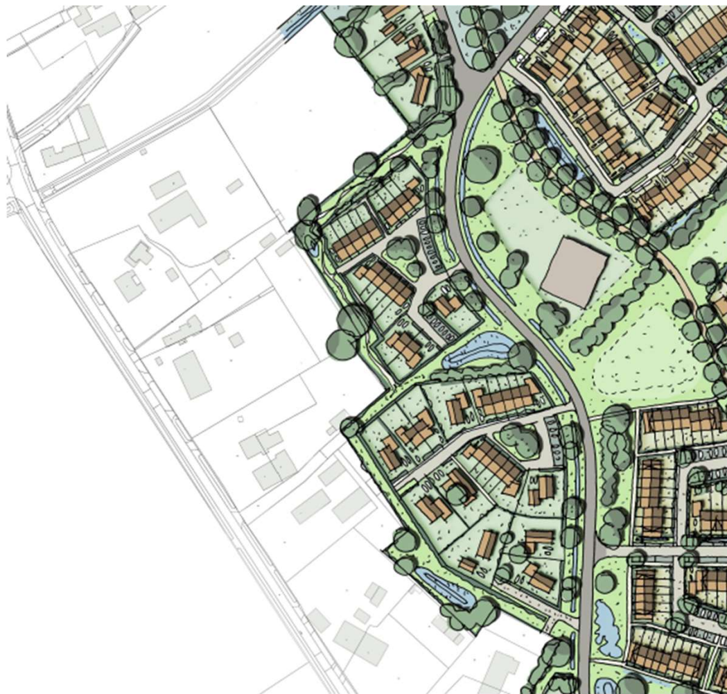
Verkavelingstekening medio juli 2024