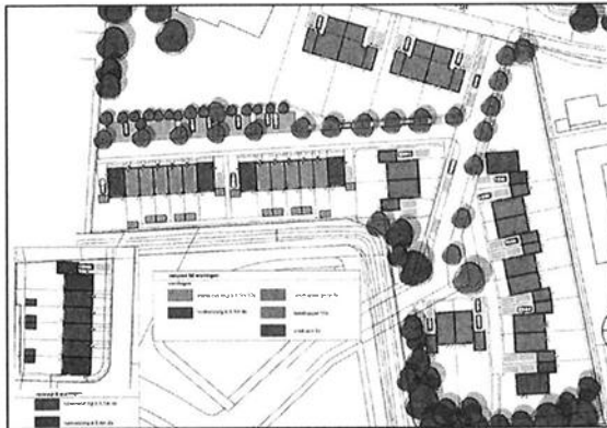
Afbeelding 1. Ontwerp 2021

In het kader van het stedenbouwkundig plan en daarmee ook het bestemmingsplan heeft Van Stiphout diversen gesprek gevoerd met omwonenden. Mede naar aanleiding van de gesprekken is het plan aangepast, waarbij met name tegemoet is gekomen aan de bewoners van Zijp 2.