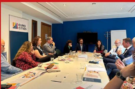
Gesprek bij Eurocities in het kader van het keuzeprogramma sociaal tijdens de EWRC.