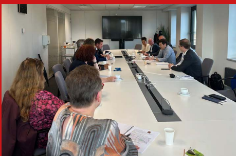
Gesprek met DG REGIO en DG EMPL van de Europese Commissie in het kader van het keuzeprogramma sociaal tijdens de EWRC.