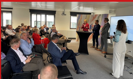
Workshop 'Actief zijn in Brussel. Water als casus', georganiseerd door Netwerkstad Twente tijdens de EWRC.