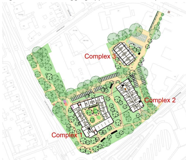
Figuur 2: Overzicht ligging appartementencomplexen binnen planlocatie.