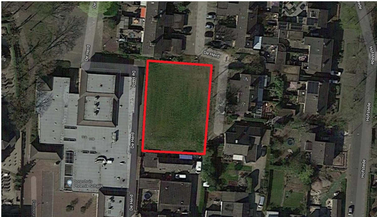
Figuur 4.1.1. Het plangebied.

De omgeving rond het plangebied is ingericht met woningen en achtertuinen.