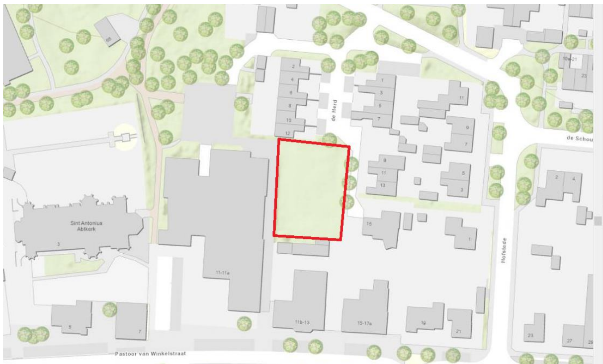
Figuur 4.3. Ligging van het plangebied (rood omlijnd) ten opzichte van het NNB (valt hier buiten de kaart).

Het dichtstbijzijnde onderdeel van het Natuurnetwerk Brabant (NNB) ligt op meer dan 100 meter van het plangebied (zie figuur 4.3).