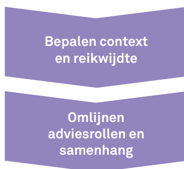
Figuur 2 Kwaliteitsadvisering doorontwikkelen in twee aanvullende stappen

Het advieskader zal de komende jaren waarschijnlijk veranderen. In de overgangsfase vanaf het inwerkingtreden van de Omgevingswet tot uiterlijk 2029 moet de gemeente het tijdelijke deel van het omgevingsplan ombouwen naar een nieuw omgevingsplan. Daarbij zal steeds de vraag zijn bij welke activiteiten een kwaliteitsadvies gewenst is en wat daarvoor de beoordelingsregels zijn. Om die dialoog niet ad hoc te voeren, worden hier twee aanvullende stappen voorgesteld voor doorgroei naar een samenhangend adviesstelsel. Het zijn stappen die uitnodigen tot dialoog over en experimenteren met de kwaliteitsadvisering.