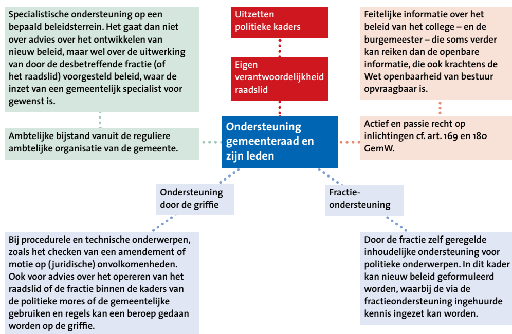
Figuur Ondersteuning gemeenteraad en zijn leden 21

Naast dit systeem van inhoudelijke ondersteuning staat de onafhankelijke rekenkamer. 22 De introductie van de rekenkamer op decentraal niveau was één van de aanbevelingen van de Staatscommissie Dualisme en lokale democratie. 23 De Staatscommissie achtte de instelling van onafhankelijke rekenkamers noodzakelijk als onderdeel van de door haar bepleite versterking van de controlerende taak van de gemeenteraad en provinciale staten. Gedegen, onafhankelijk rekenkameronderzoek naar de doeltreffendheid, doelmatigheid en rechtmatigheid van het gevoerde bestuur zou de decentrale volksvertegenwoordiging in staat stellen om in de gedualiseerde verhoudingen de controle te verbeteren op de bereikte effecten van beleid en de besteding van middelen.