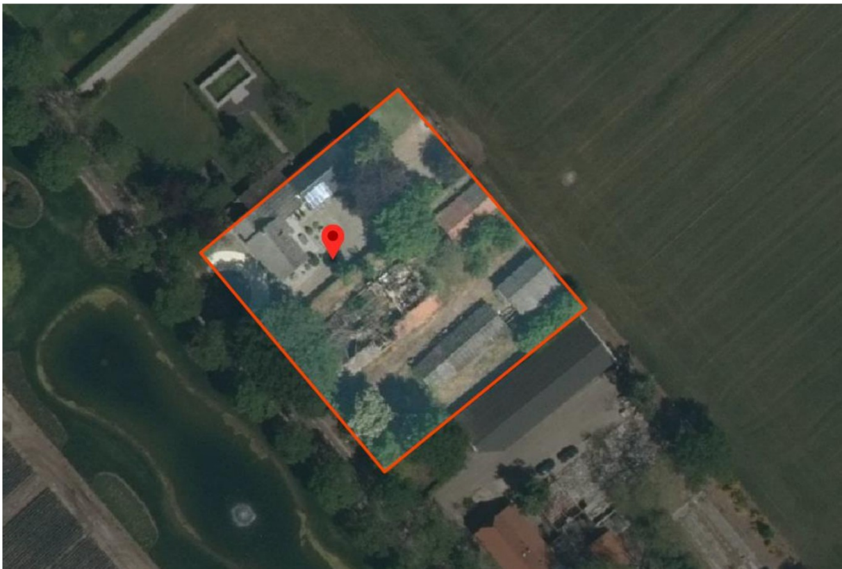
Figuur: Begrenzing plangebied

Aan de Duifhuizerweg 22 te Uden is de wens om de oude boerderijbebouwing op de locatie te herstellen. In het plangebied bevinden zich een voormalige agrarische bedrijfswoning (nr. 22) met bijbehorend bouwwerk en een oude boerderij met een drietal bijbehorende bouwwerken. De oude boerderij is niet meer in gebruik en verkeerd momenteel in slechte staat. Beoogd wordt om de oude boerderij te herstellen en hierin een woning te realiseren. Ten behoeve van deze ontwikkeling dient inzichtelijk te worden gemaakt of ter plaatse sprake is van een goed woon- en leefklimaat.