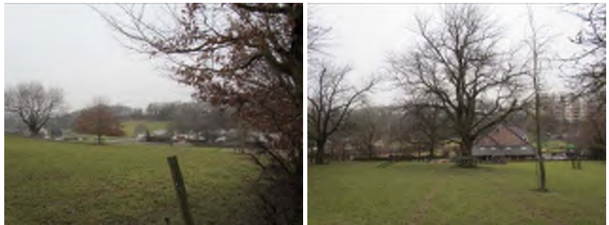
Weiden en de kersenboomgaard.