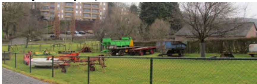
Bestaande haag oostelijke perceelsgrens