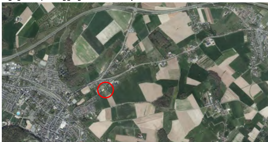
Ligging planlocatie (pdok.nl)

De planlocatie ligt in het agrarisch buitengebied, nabij de dorpsrand van Valkenburg. De Hekerbeekweg loopt van de kern van Valkenburg tot aan de doorgaande weg naar Klimmen. In navolgend hoofdstuk wordt verder ingegaan op de ligging en de ruimtelijke context.