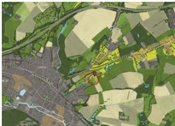
Kaart groene karakter

kenmerkende afwisselingen in het landschap. Opgaande beplanting is voornamelijk rondom de kernen te vinden, waar bodemkundig gezien de grond voor akkerbouw minder geschikt is.