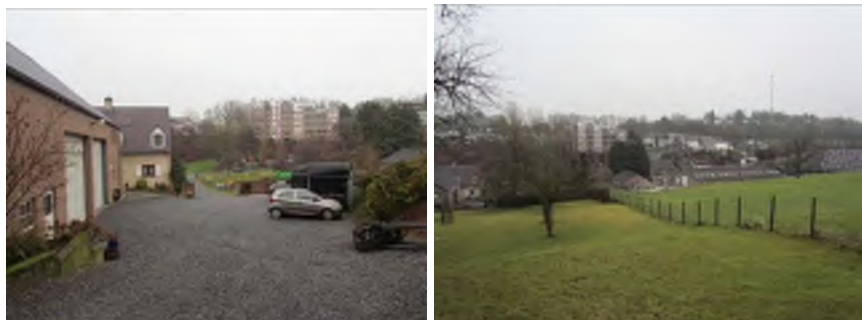
Het erf en de oostelijke rand van de boomgaard

De planlocatie bestaat uit een agrarisch erf met bedrijfsbebouwing en een bedrijfswoning. Vanaf de Hekerbeekweg leidt een halfverharde toerit naar een erf met bedrijfswoning, opslag en een schuur met stallen op het achtererf. Heuvelopwaarts ligt een boomgaard met hoogstam kersenbomen en een dierenweide met stal. Aan de zuidwestzijde ligt eveneens een kleine dierenweide waarin kleinvee rondloopt. Tevens ligt aan deze zijde een rijbak voor paarden. De overige gedeelten van de planlocatie bestaan uit weiden met enkele solitaire bomen.