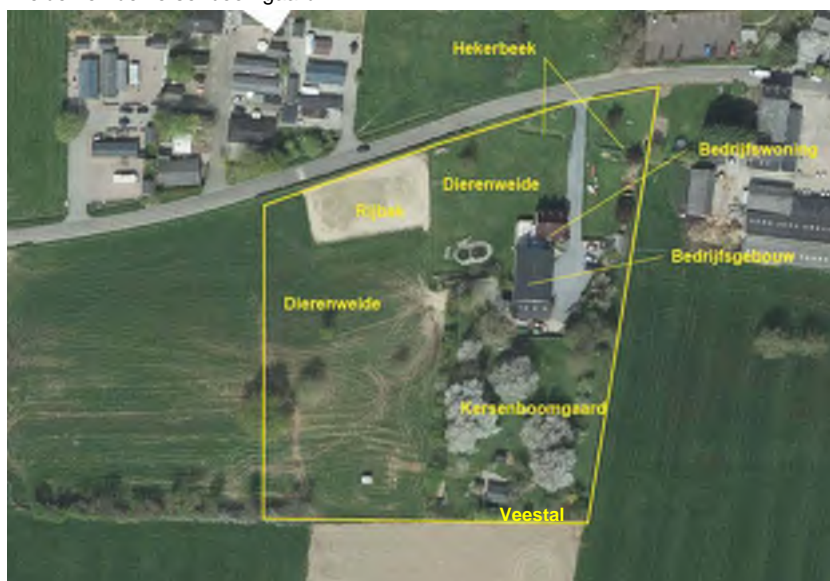
Huidige situatie planlocatie