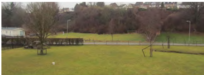
Aanvullen geschoren haag voorzijde

Aan de oostzijde van de planlocatie staat reeds een geschoren ligusterhaag op de perceelsgrens. Aan de achterzijde is dit voor een landschappelijke inpassing onnodig omdat hier het erf met beeldbepalende hoogstamboomgaard overgaat in de aangrenzende weidepercelen. Tevens staan hier reeds enkele bomen zoals eiken die de grens markeren. Aan de westzijde wordt de locatie ingebed middels een geschoren haag over de gehele diepte van het perceel. De haag mag ten hoogste 1.20 meter hoog worden om de locatie zichtbaar te houden vanuit de omgeving. De haag volgt het reliëf en accentueert daarmee de hoogteverschillen.