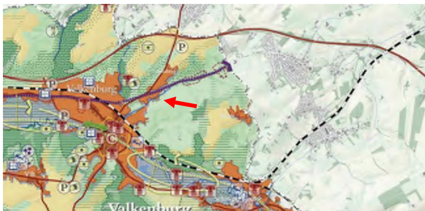
Uitsnede visiekaart Intergemeentelijke Structuurvisie Gulpen-Wittem, Vaals en Valkenburg aan de Geul

De gemeente Valkenburg aan de Geul beschikt, samen met de gemeenten Gulpen-Wittem en Vaals, over een gemeentelijke structuurvisie voor haar grondgebied. In deze structuurvisie worden de strategische keuzes met betrekking tot ruimtelijke ontwikkelingen binnen de gemeentegrens voor de lange termijn (15 jaar) vastgelegd.