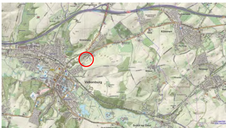
Ligging planlocatie op de topografische kaart (opentopo.nl)

De planlocatie ligt aan de dorpsrand van Valkenburg. Deze wordt ontsloten via de Hekerbeekweg, een bebouwinglint dat van de kern tot aan de Hekerweg in het buitengebied loopt. De weg vormt daarmee een gebiedseigen en karakteristieke oudere route, zoals die in het Zuid-Limburgse buitengebied meer voorkomen. Daar waar geleidelijke verdichting met agrarische- en woonbebouwing is ontstaan, is stedenbouwkundig sprake van lintvorming. Dit zijn bebouwingslinten die langs oude landwegen zijn gegroeid. De Hekerbeekweg is een uitloper van een bebouwingslint in de kern, waarbij ter hoogte van de planlocatie sprake is van een lagere bebouwingsdichtheid met agrarische bedrijven en een woonwagenlocatie.