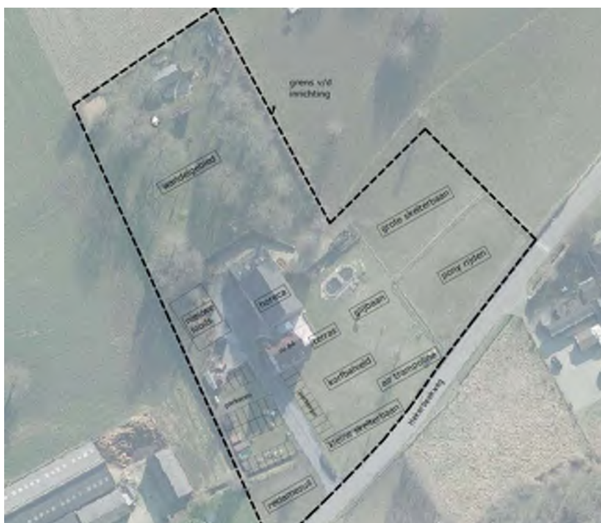
Overzicht van de voorgenomen activiteiten.

Naast de huidige agrarische activiteiten, akkerbouw en het houden van paarden en kleinvee, wordt het bedrijf getransformeerd naar een kinderspeelboerderij. Hiervoor worden in de bestaande loods diverse speelvoorzieningen en ruimten voor kleine dieren gerealiseerd. Op het buitenterrein worden eveneens dieren gehouden en worden speelvoorzieningen (toestellen maar ook informeel ingerichte speelmogelijkheden en een skelterbaan) aangelegd evenals de benodigde parkeerruimte. Dit alles vraagt om een goede landschappelijke inbedding, te meer vanwege de ligging is het waardevolle cultuurlandschap van Zuid Limburg. Bovendien is de beleving van landschap en groen, van seizoenen, fruitbomen en andere elementen die bij het agrarisch bedrijf horen, onderdeel van het bedrijfsconcept. De speelboerderij is niet alleen gericht op spelen in een traditionele speeltuin, maar ook op het laten proeven, ruiken, voelen en beleven van de plek. Een goed landschappelijk casco op en rond het erf draagt hier sterk aan bij.