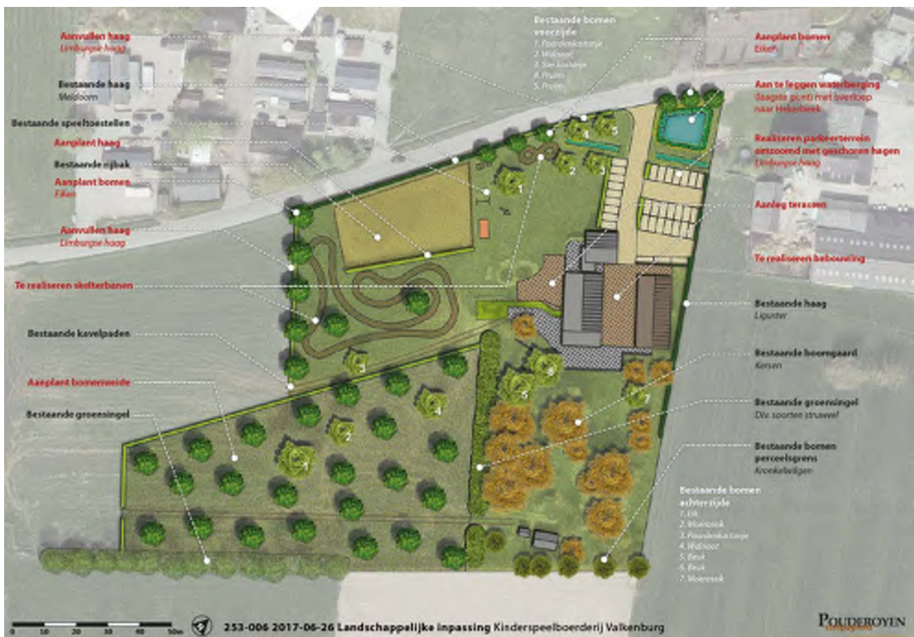
Tekening landschappelijke inpassing (zie bijlage voor een groter exemplaar)