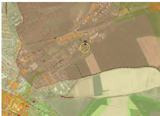
Kaart cultuurhistorisch erfgoed

De bebouwing van de planlocatie bevat geen bijzondere cultuurhistorische waarde, aangezien het relatief jonge bebouwing betreft. In de nabijheid van de locatie treft men waardevol erfgoed in de kern van Valkenburg en in de historische linten. Nabij de planlocatie staan grondgebonden en gestapelde woningen. Tegenover de locatie ligt een klein woonwagencuster en een flat. Van cultuurhistorisch waardevolle bebouwing in de directe omgeving is derhalve geen sprake. De cultuurhistorische waarde op locatie is wel deels gelegen in de ensemblewaarde, waarbij een agrarisch erf van woning en bedrijfsgebouwen vanuit de historie kenmerkende elementen heeft, zoals hagen en singels op de erfrand en een fraaie, oude hoogstam kersenboomgaard aan de achterzijde.