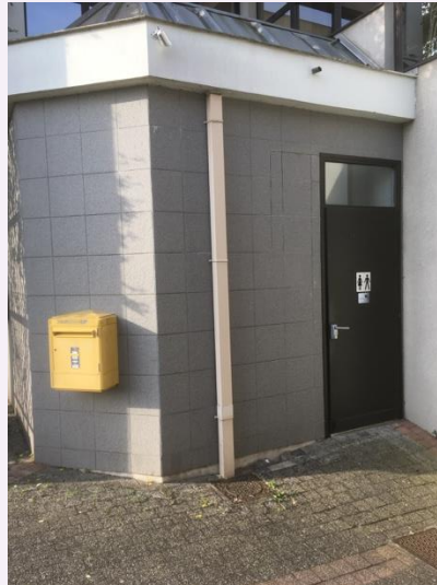
Bessines (2700 inwoners), Frankrijk

Ook in kleine dorpen een openbare wc (in Nederland zelden tot nooit, tenzij ze heel toeristisch zijn)