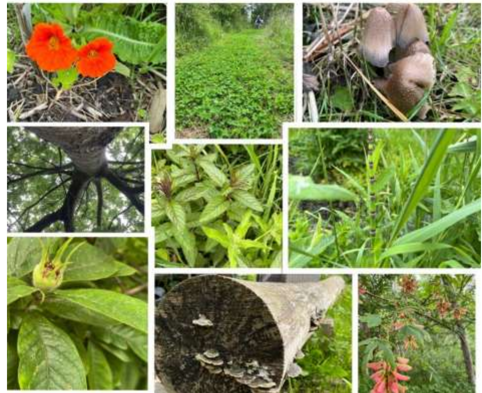
Figuur 2 Compositie van De Groene Oase - Koedijk

Het recreatieschap had geen budget 'onvoorzien' begroot.