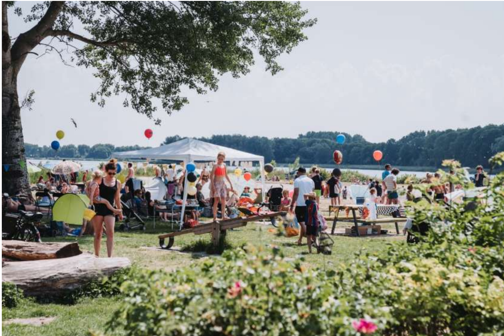
Figuur 6 Feest bij baai – paviljoen El Chiringuito