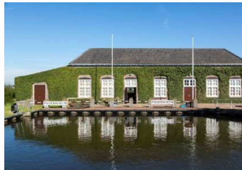
Figuur 9 Poldermuseum Het oude Gemaal bij Park van Luna