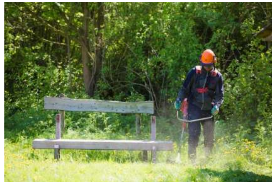
Figuur 5 Maaiwerkzaamheden langs de Zomerdel

De baten op dit taakveld zijn € 18.790 hoger dan begroot en worden verklaard door niet begrote hogere opbrengsten voor bagger vergoeding.