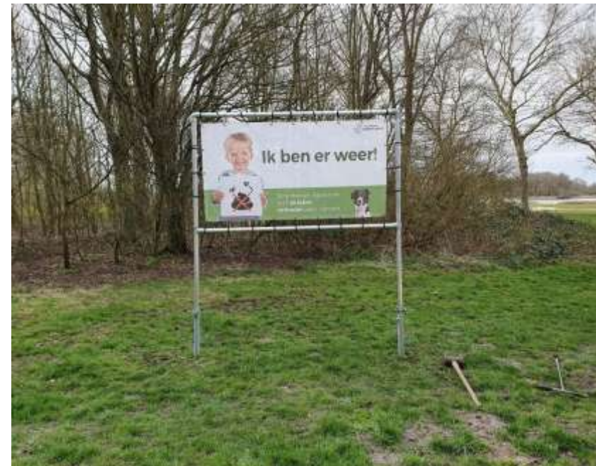
Figuur 7 Aankondiging zomerseizoen - honden aan de lijn