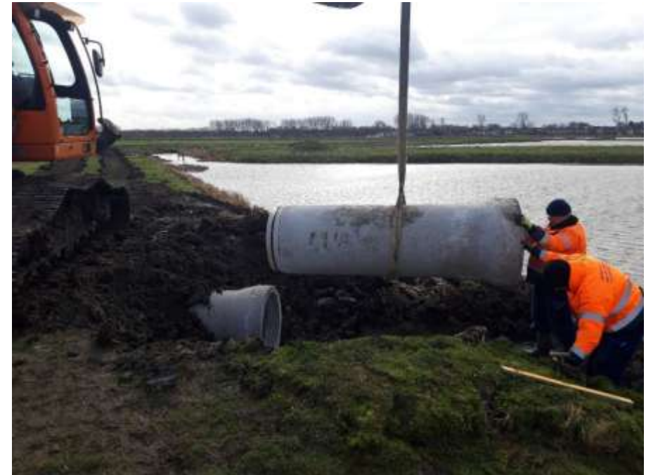
Figuur 4 Plaatsen van duikers in de Kleimeer