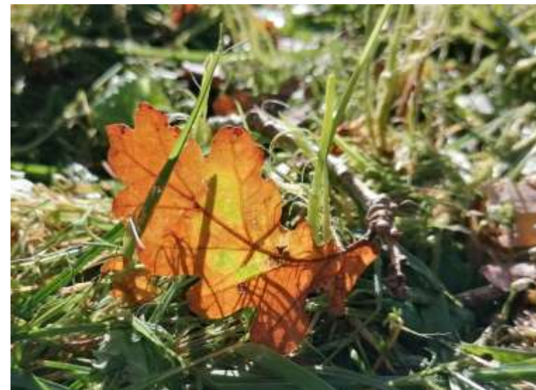
Figuur 3 Eikenblad in de herfst