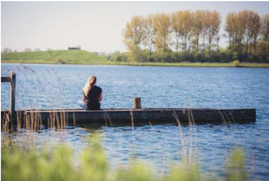
Figuur 1 Uitzicht over de Zomerdel