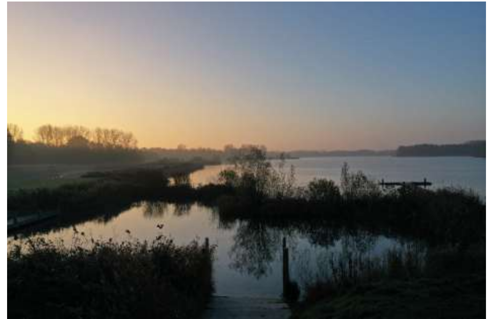
Figuur 10 Avondfoto bij Zomerdel