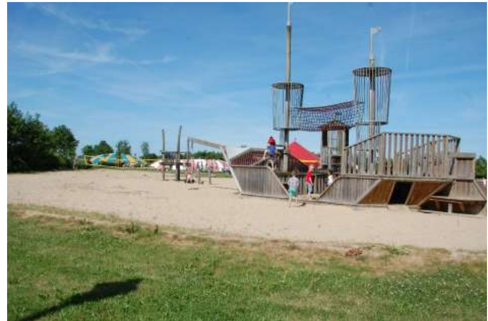
Figuur 11 Spelende kinderen bij De Swaan

Onderstaand volgt de balans per 31 december 2025, een overzicht van de waarderinggrondslagen en de toelichting op de balans.