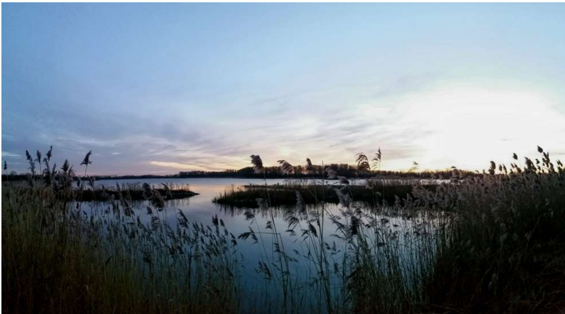
Figuur 8 Avondfoto Zomerdel