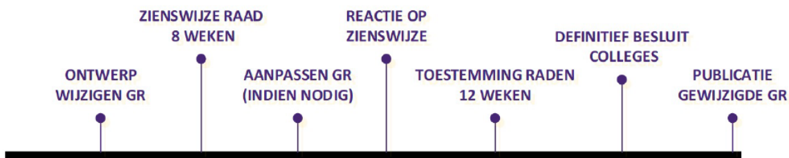
Figuur 1. De procedure voor het wijzigen van een GR (per 1 juli 2024)

Bijdragen aan een gemeenschappelijke regeling zijn verplichte uitgaven voor een gemeente. Deze moeten worden verwerkt in de begroting van de gemeente zelf. Om gemeenteraden meer positie te geven in de begrotingscyclus van een gemeenschappelijke regeling, koos de wetgever ervoor de termijnen voor de indiening van de kadernota (van 15 april naar 30 april), ontwerpbegroting (van 8 weken naar 12 weken voor vaststelling) en begroting (van 1 augustus naar 15 september) aan te passen. De bedoeling is dat begrotingscyclus van gemeenschappelijke regelingen beter aansluit op die van gemeenten. De gevolgen van de uitgaven aan de regelingen voor de eigen gemeente komen zo beter in zicht. De raden krijgen langer de tijd om een zienswijze op de conceptbegroting van een regeling te geven (van 8 naar 12 weken). Ze ontvangen de kadernota later (30 april in plaats van 15 april). De wet staat toe om met de deelnemers kortere termijnen af te spreken. Afspraken over langere termijnen zijn niet toegestaan. In onze regio maken we al gebruik van de mogelijkheid om kortere termijnen af te spreken bij de kadernota. Deze wordt door de regelingen eerder aangeboden. Dit biedt de mogelijkheid de begroting aan te passen, als gevolg van zienswijzen op de kadernota. Deze bepaling geldt direct vanaf 1 juli 2022, zonder dat de GR is aangepast. De nieuwe termijnen moeten ook in de GR te worden opgenomen.