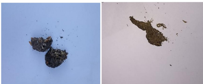
Figuur 4.4.2. Een van de braakballen van de kerkuil (links) en het uitwerpsel van de steenmarter (rechts).

In de zuidelijke stal zijn braakballen (zie figuur 4.4.2) en uitwerpselen van de kerkuil aangetroffen. Verder kunnen Kerkuilen de stal binnen door de open ramen in de kopgevels (zie figuur 4.4.1). De bebouwing dient dus als roestplaats voor de kerkuil.