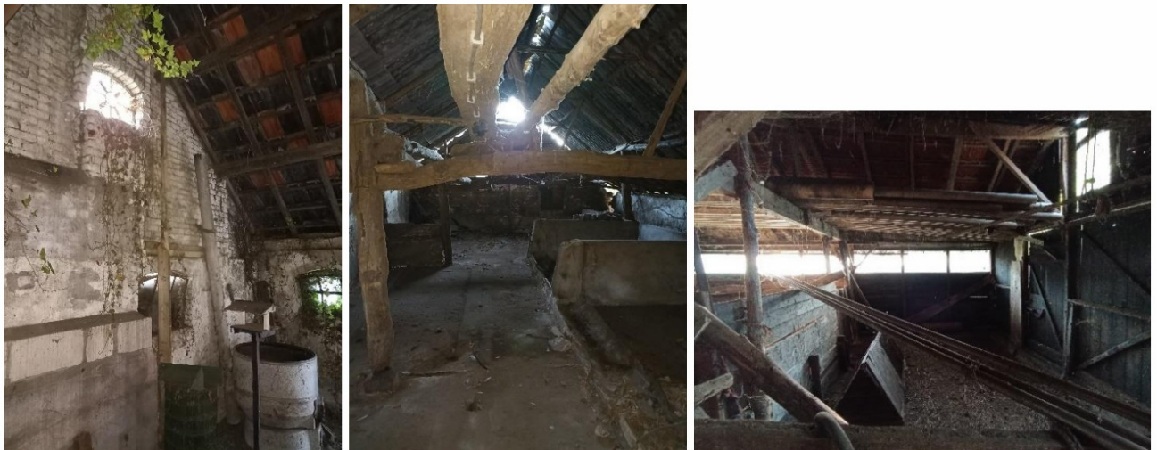
Figuur 4.4.1. De gevels en daken van de zuidelijke stal (links en midden) en de noordelijke stal (rechts).

Van de monumentale boerderij ontbreekt het enkelwandige dak grotendeels (zie afbeeldingen voorzijde rapport) en de gevels zijn tevens enkelwandig. Ook bij de twee stallen en de open schuur zijn zowel de daken als de gevels enkelwandig (zie figuur 4.4.1). De gebouwen zijn hierdoor niet geschikt als (jaarrond beschermde) nestlocatie voor vogels en/of verblijfplaats voor vleermuizen. De aanwezigheid van vleermuisverblijven of (jaarrond beschermde) vogelnesten zijn hier dus uitgesloten.