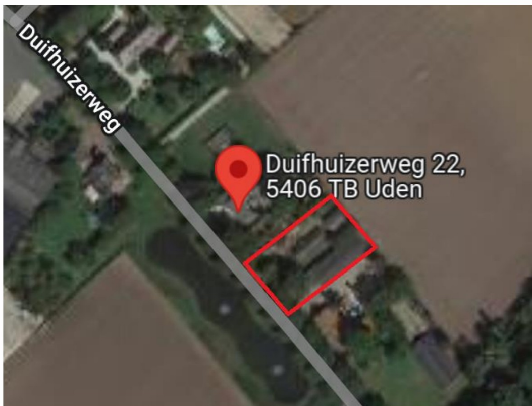
Figuur 4.1. De ligging van het plangebied (rood omlijnd).

Het plangebied ligt aan de rand van de kern Uden en aan de Duifhuizerweg (zie figuur 4.1). De omgeving rondom het plangebied is landelijk ingericht met aan alle zijden akkers en woningen met tuinen. In het plangebied bevinden zich diverse gebouwen; een monumentale boerderijwoning, twee oude stallen en een open schuur. In het plangebied groeien algemene plantensoorten als zomereik, beuk, ruwe berk, Noorse esdoorn, walnoot, valse acacia, hulst, winterpostelijn, paardenbloem, vogelmuur, grote brandnetel, klimop, brem, duizendblad, hondsdrif, bosaardbei, bezemkruiskruid, ridderzuring, smeerwortel en Canadese fijn straal.