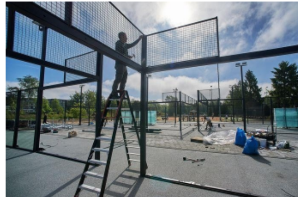
LTC Uden (4 banen)