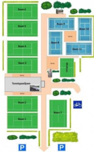
Erp (4 banen)