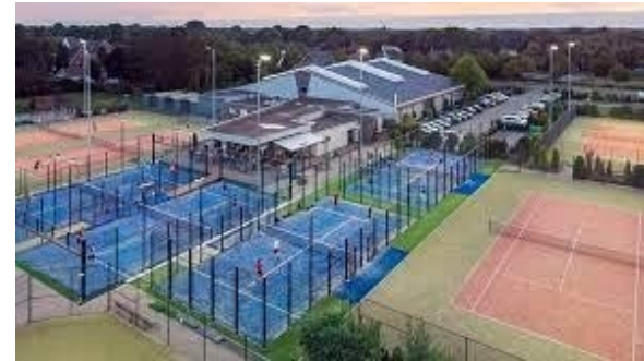
Mariaheide (8 banen)