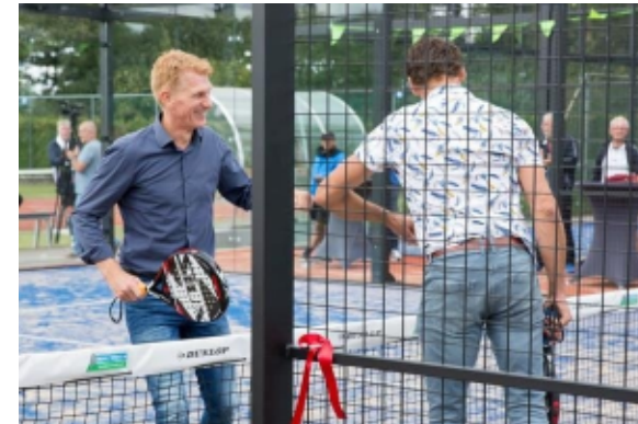
Zeeland (2 banen)