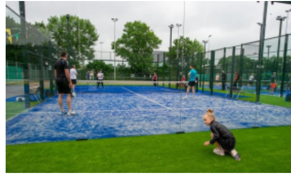
Gemert (3 banen)