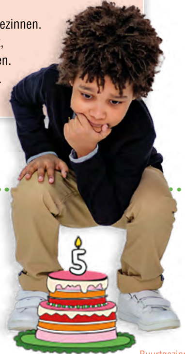
Buurtgezinnen bestaat 5 jaar!