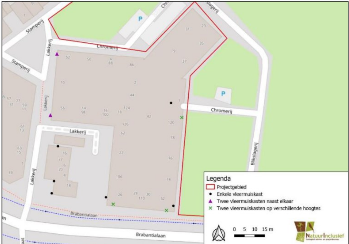
Figuur 2. Locatie van de tijdelijke vleermuisvoorzieningen.