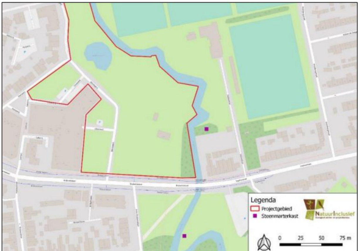
Figuur 3. Locatie van de permanente steenmarker voorzieningen.