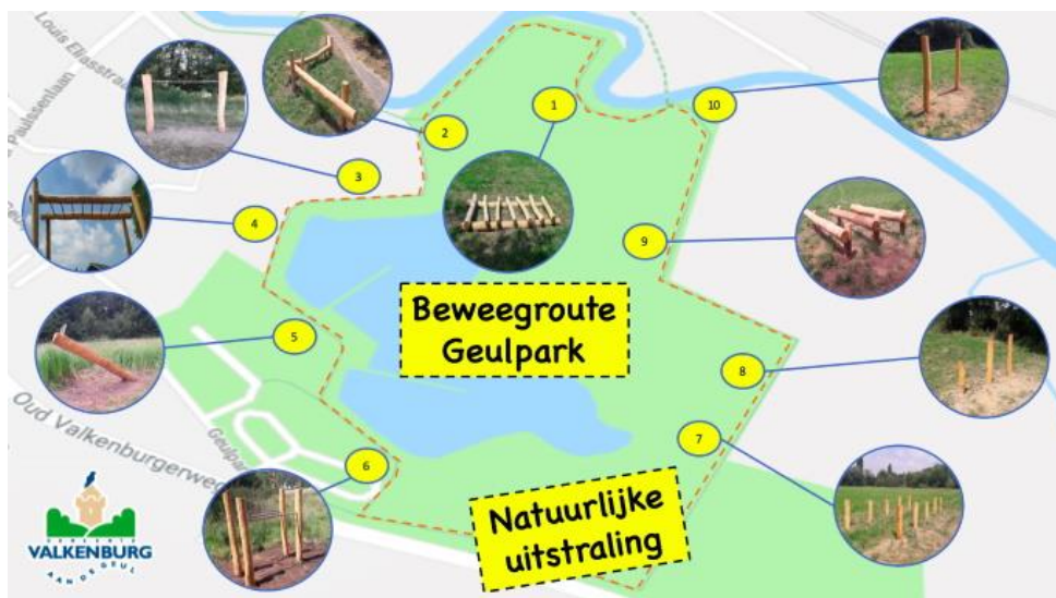
Afbeelding 3.1 Beweegroute Geulpark