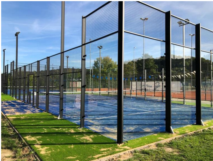
Afbeelding 2.2 Padelbanen bij Tennis Padel Geuldal

Tennis Padel Geuldal is in 2013 ontstaan uit de fusie tussen de verenigingen LTC Iason (Houthem) en LTC Munster (Berg en Terblijt). In 2018 heeft de vereniging het nieuwe tennispark betrokken. De aanleg van 2 padelbanen op het nieuwe tenniscomplex in Houthem past uitstekend bij landelijke ontwikkelingen. Veel tennisverenigingen introduceren padel om meer leden te krijgen en te behouden en de KNLTB verwacht dat binnen tien jaar zo'n 500 tennisverenigingen de keuze hebben gemaakt voor één of twee padelbanen.