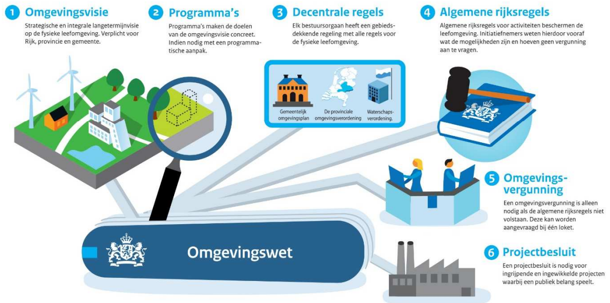
Figuur 1 De zes nieuwe instrumenten van de Omgevingswet

De gemeente kan met de omgevingsvisie, programma's, het omgevingsplan en de omgevingsvergunning sturen op de fysieke leefomgeving. De Omgevingswet schrijft niet voor op welke wijze participatie bij het opstellen van deze instrumenten plaats moet vinden. In de aard van de wet ligt echter besloten dat de maatschappij een grote(re) rol, vroeg in het proces zal moeten krijgen. Dit kan in de vorm van een omgevingsdialoog.